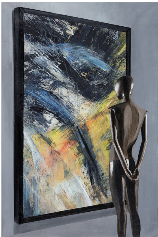
links: Im Museum 2017, Acryl auf Leinwand 105 × 70 cm