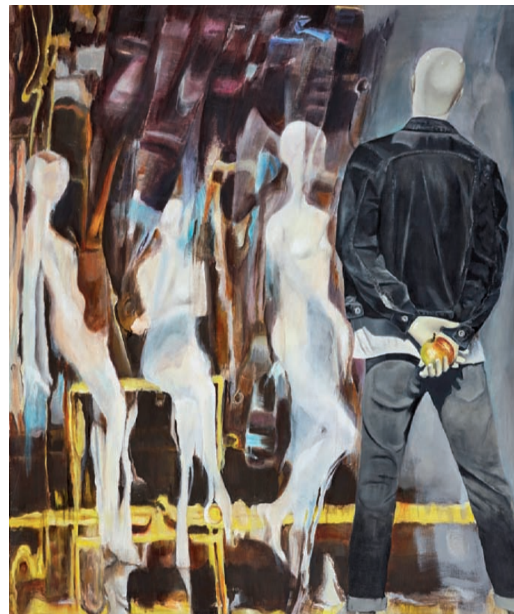
oben: Das Urteil des Paris 2, 2017, Öl auf Leinwand, 120 × 100 cm links: Das Urteil des Paris 1, 2017, Öl auf Leinwand, 120 × 100 cm