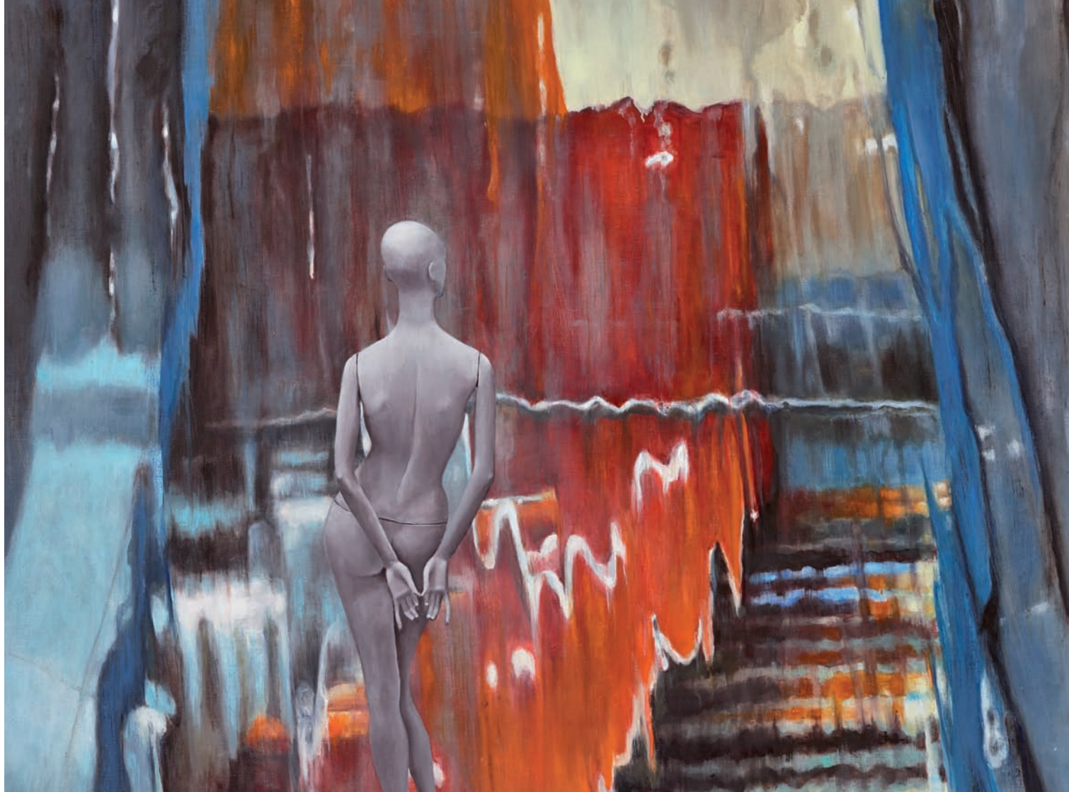
Eine Treppe betrachtend 2016, Öl auf Leinwand, 100 × 120 cm