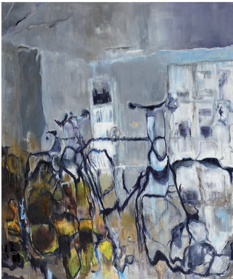
links: Radwelt 2016, Öl auf Leinwand, 120 x 100 cm rechts: Gegen die Zeit 2017, Öl auf Leinwand 100 x 70 cm