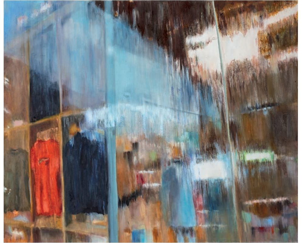
oben: Schaufenster , 2016, Öl auf Leinwand, 100 × 120 cm links: Austauschbar , 2016, Öl auf Leinwand, 120 × 100 cm