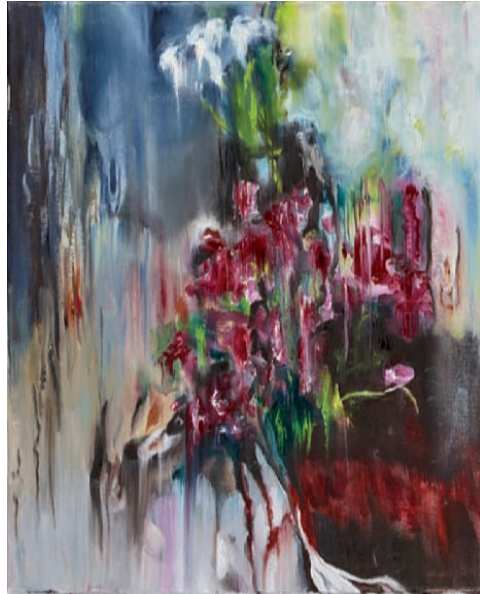
Abgeschnitten, 2016, Öl auf Leinwand, 50 × 40 cm