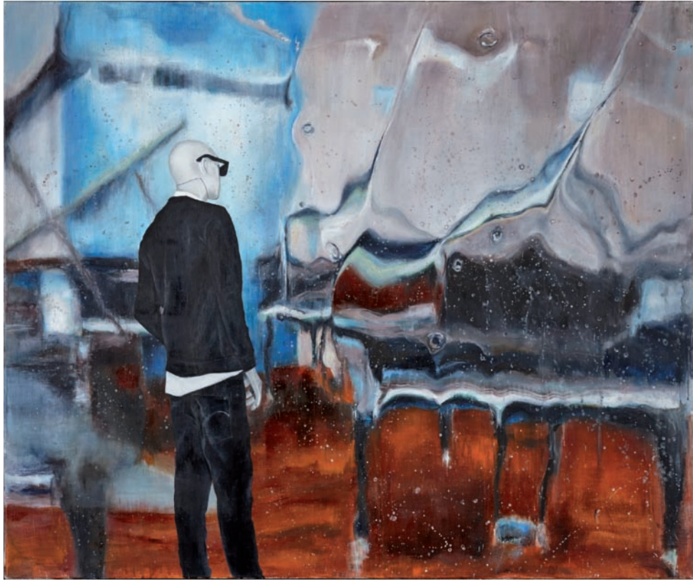
oben: Pianohaus, 2016, Öl auf Leinwand, 100 × 120 cm rechts: Brautkleid, 2016, Öl auf Leinwand, 120 × 100 cm