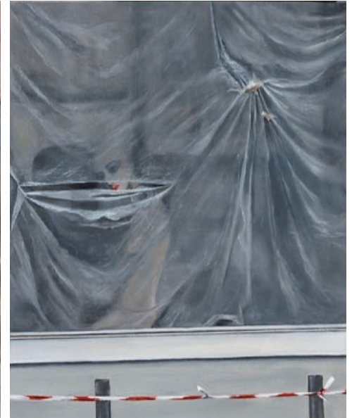
Zurückgelassen, 2017, Öl auf Leinwand, 50 × 40 cm