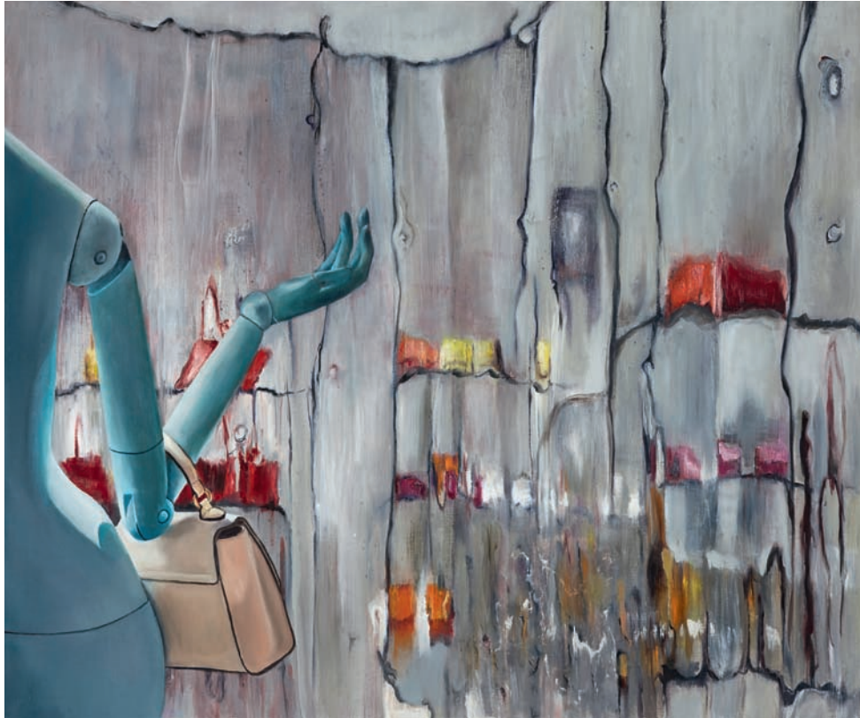
oben: Handtaschen, 2016, Öl auf Leinwand, 100 × 120 cm rechts: Ein Kleid betrachtend, 2016, Öl auf Leinwand, 100 × 70 cm