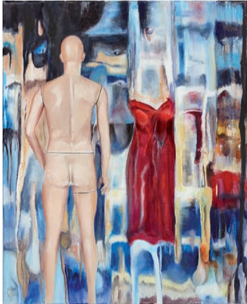
Gender Mix, 2016, Öl auf Leinwand, 50 × 40 cm