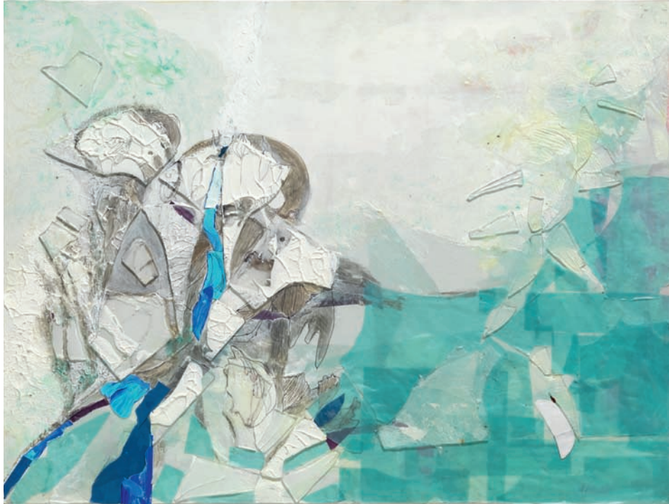
Comunicazione I 2013, Collage mit Glasscherben, Acryl, Fineliner, auf Malkarton, 59,5 × 80 cm