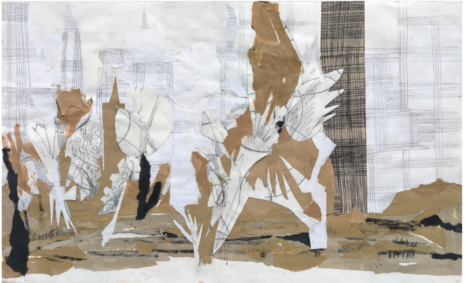
Spazi di vita V 2013, Collage/Decollage, Fineliner, Bleistift auf Papier, 103 × 62 cm