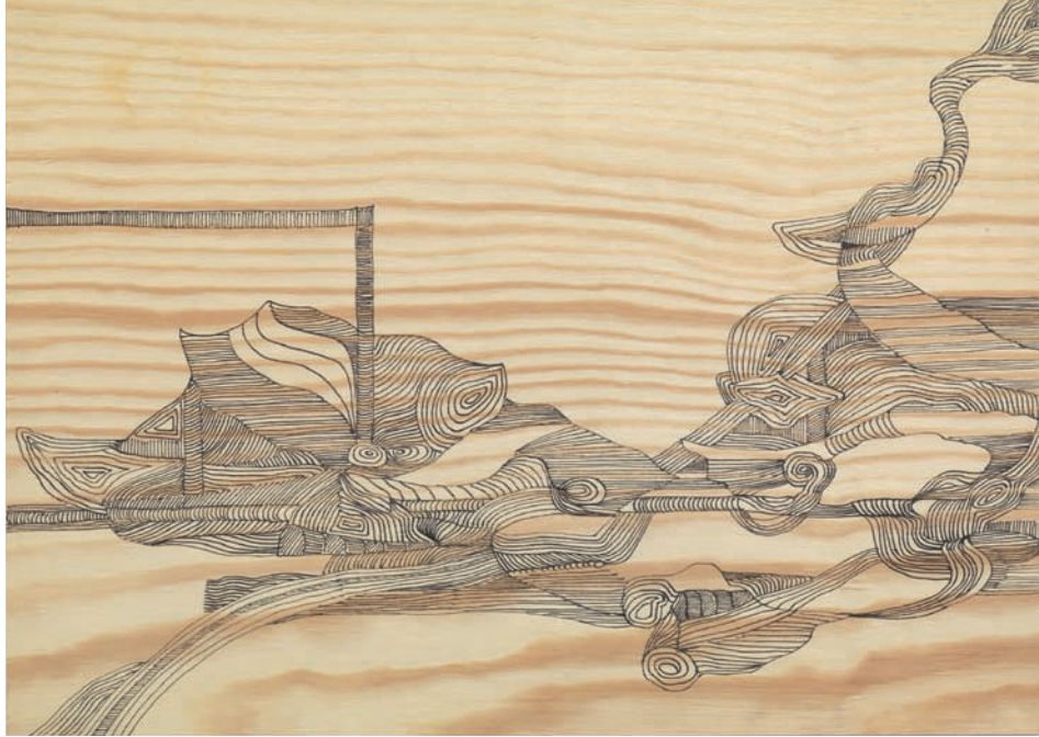
Movimento III 2014, Fineliner auf Sperrholz, 30 × 42 cm