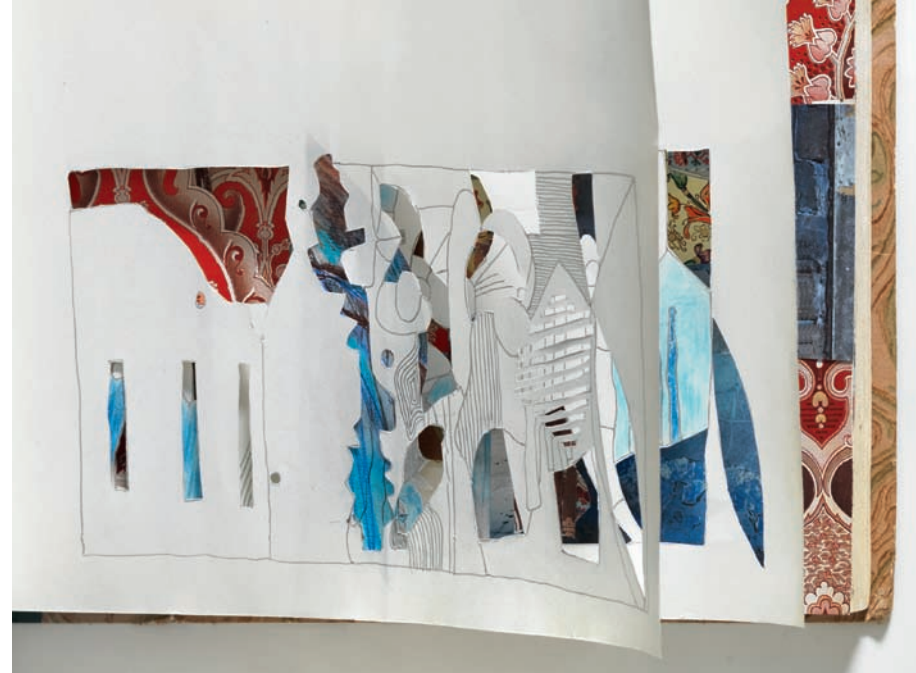
Mistero 2013/14, Collagenbuch, 40 × 33 cm