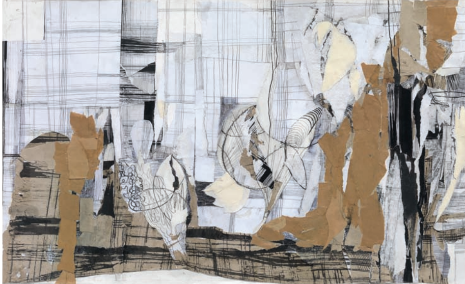
Spazi di vita VI 2013, Collage/Decollage, Fineliner, Bleistift auf Papier, 103 × 62 cm