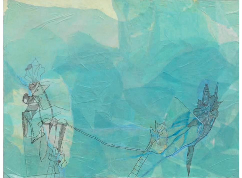
Comunicazione II 2014, Collage mit Glascherben, Fineliner, auf Malkarton, 59,5 × 80 cm