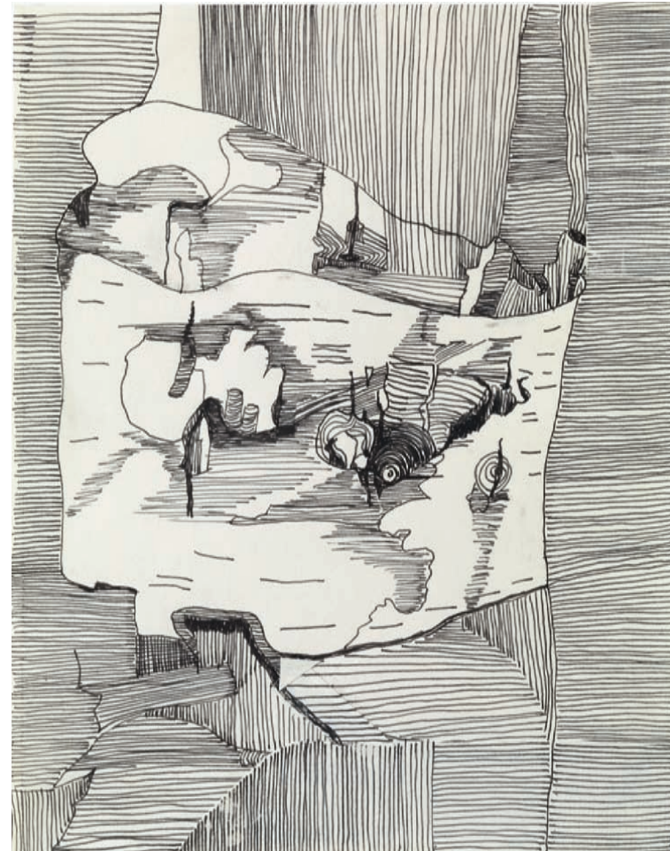
Betulla 2014, Fineliner auf Papier 22,2 × 28 cm