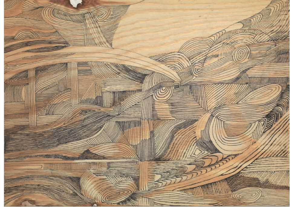
Movimento II 2014, Fineliner auf Sperrholz, 30 × 42 cm