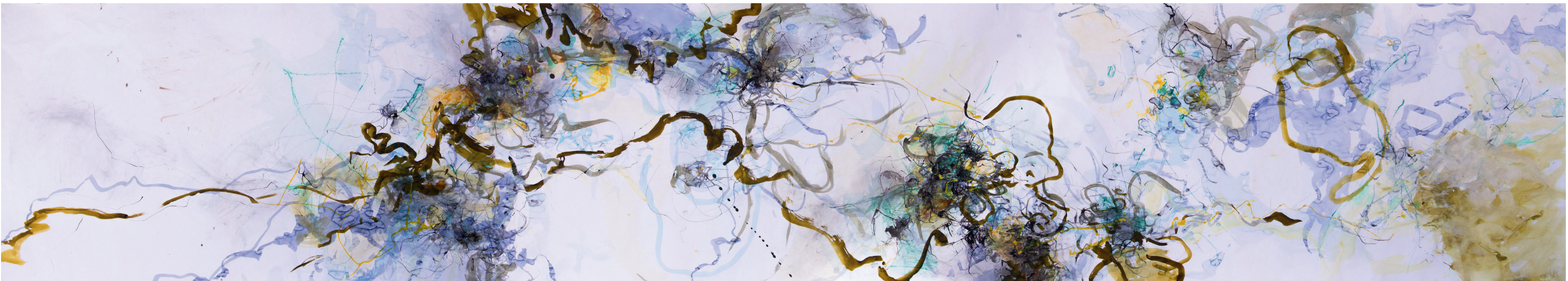
Wenn wir in einer Frage leben, verändert sich der Brennpunkt unserer Aufmerksamkeit 2016, Tusche, Aquarellstifte und Graphit auf Papier, 550 x 100 cm