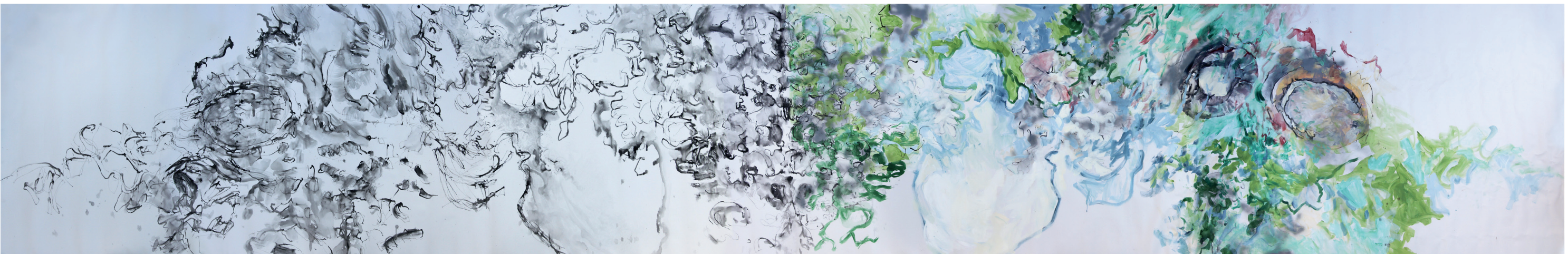
Unserem Schatten begegnen 2016, Acryl und Graphit auf Leinwand, 10 x 1,60 m