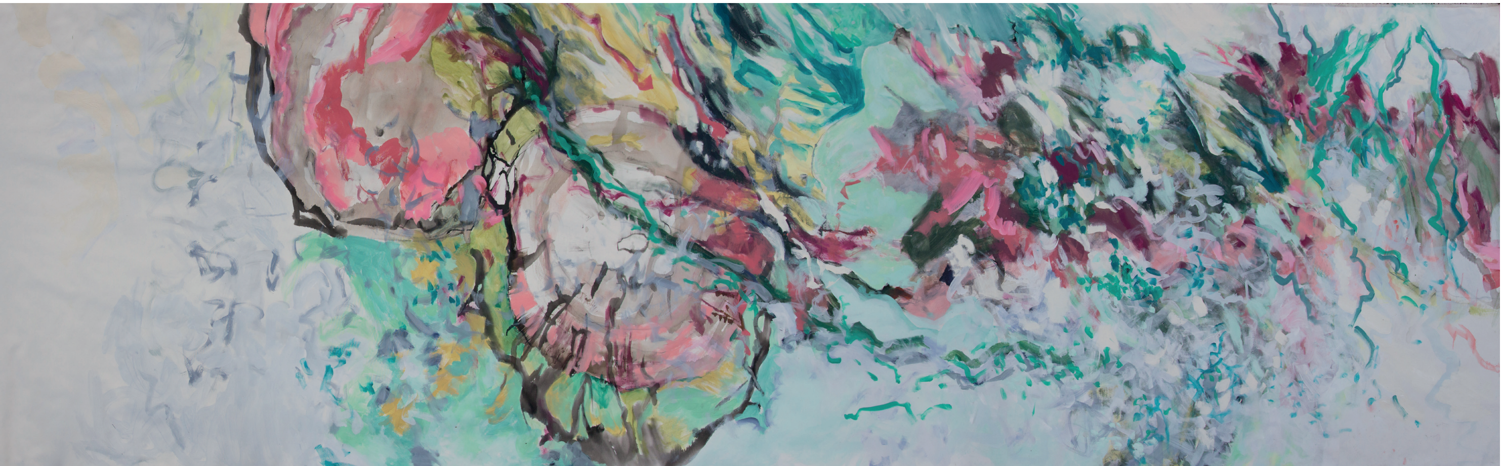
Unser Bedürfnis nach Kontrolle aufgeben 2016, Graphit, Tusche und Acryl auf Leinwand, 550 x 160 cm