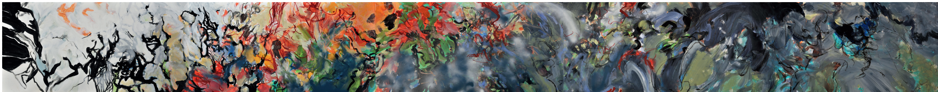
Unsere Gedanken erschaffen die Atmosphäre ... 2017, Graphit und Acryl auf Leinwand, 50 x 500 cm