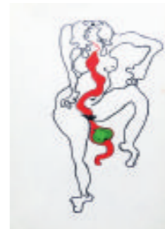
Evelin Daus Eva im Paradies