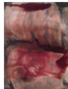
Ana Tansia foolish is foolish is