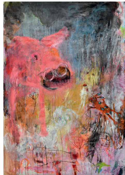
Sturzregenereignis , Acryl auf Leinwandstoff, 220 × 150 cm

links: Abschiebebeobachter , Acryl auf Leinwand, 50 × 40 cm (Ausschnitt)