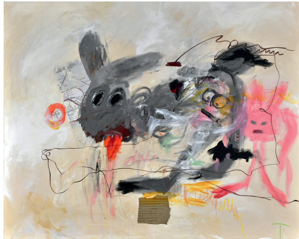
Killervariante an der Möckernbrücke Acryl auf Leinwand 100 × 80 cm