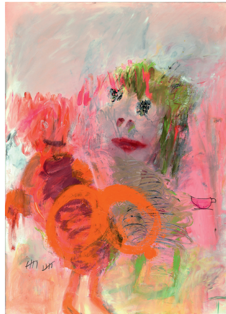
Busenfreundinnen Acryl auf Leinwand 70 × 50 cm