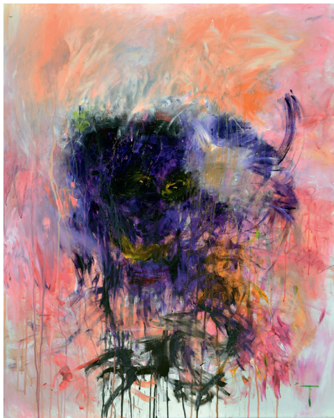
Killervariante 2 Acryl auf Leinwand 100 × 80 cm