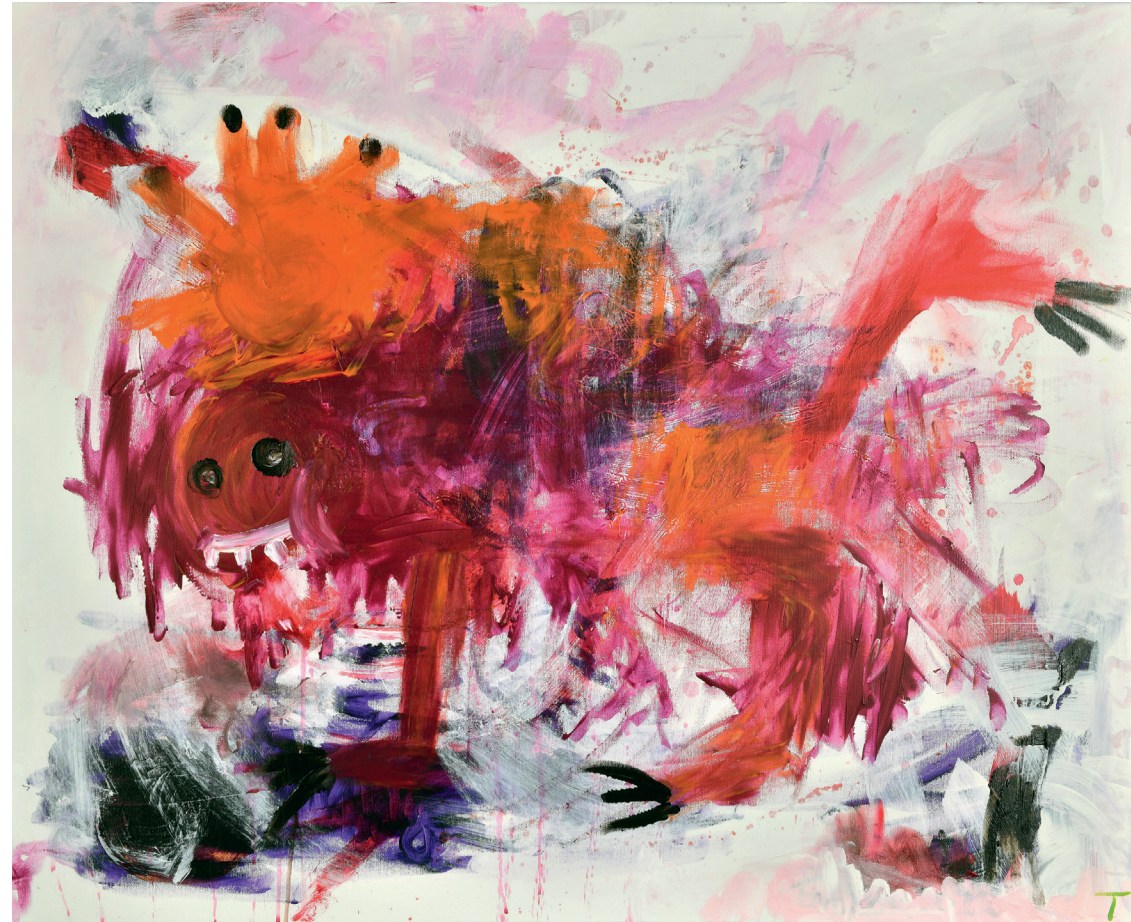
Killervariante, Acryl auf Leinwand, 80 × 100 cm

Ute Wöllmann, Akademieleiterin Berlin, im September 2023