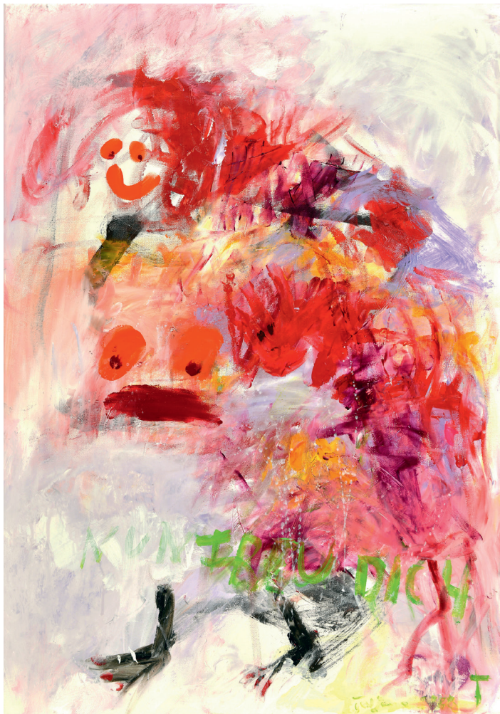
Humorkolleginnen Acryl auf Leinwand 70 × 50 cm