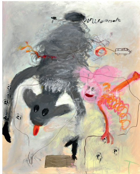
Killervariante an der Eisenacher Straße Acryl auf Leinwand 100 × 80 cm