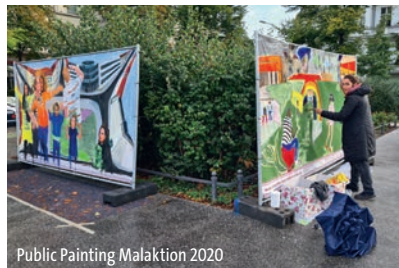
Public Painting Malaktion 2020

Ein Projekt der Akademie für Malerei Berlin Hardenbergstraße 9 | 10623 Berlin