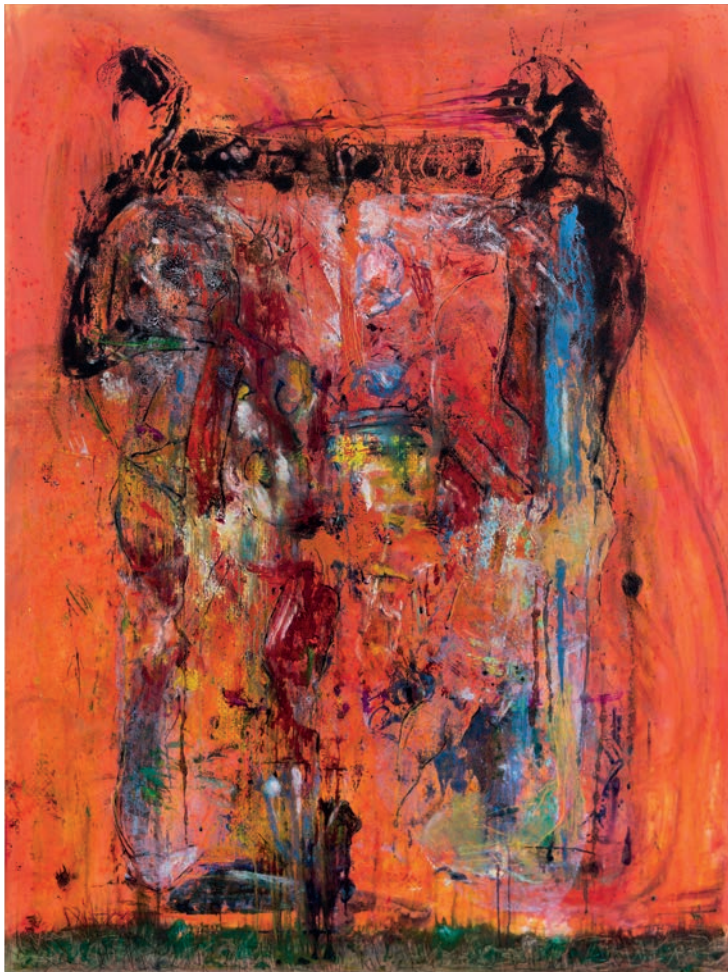
Geschlechter 2023 Öl auf Leinen 200 × 150 cm