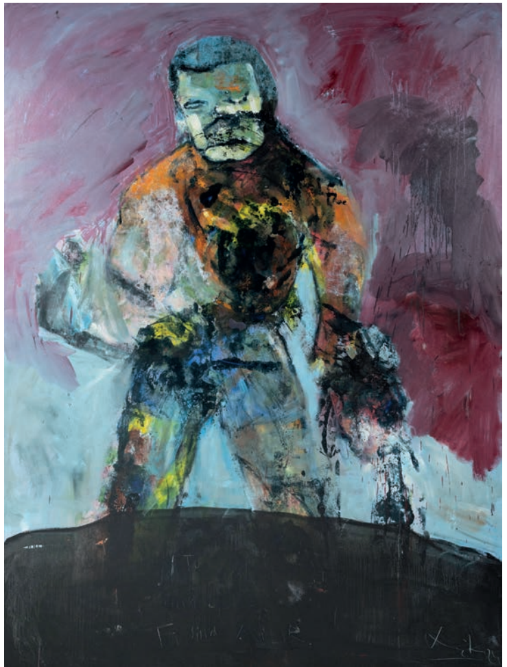
Kämpfernatur 2024 Öl auf Leinen 200 × 150 cm