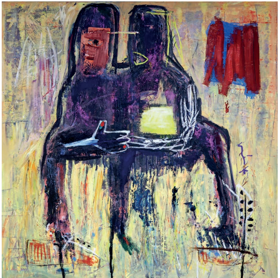
Versprechen, 2024, Öl auf Leinen, 150 × 150 cm