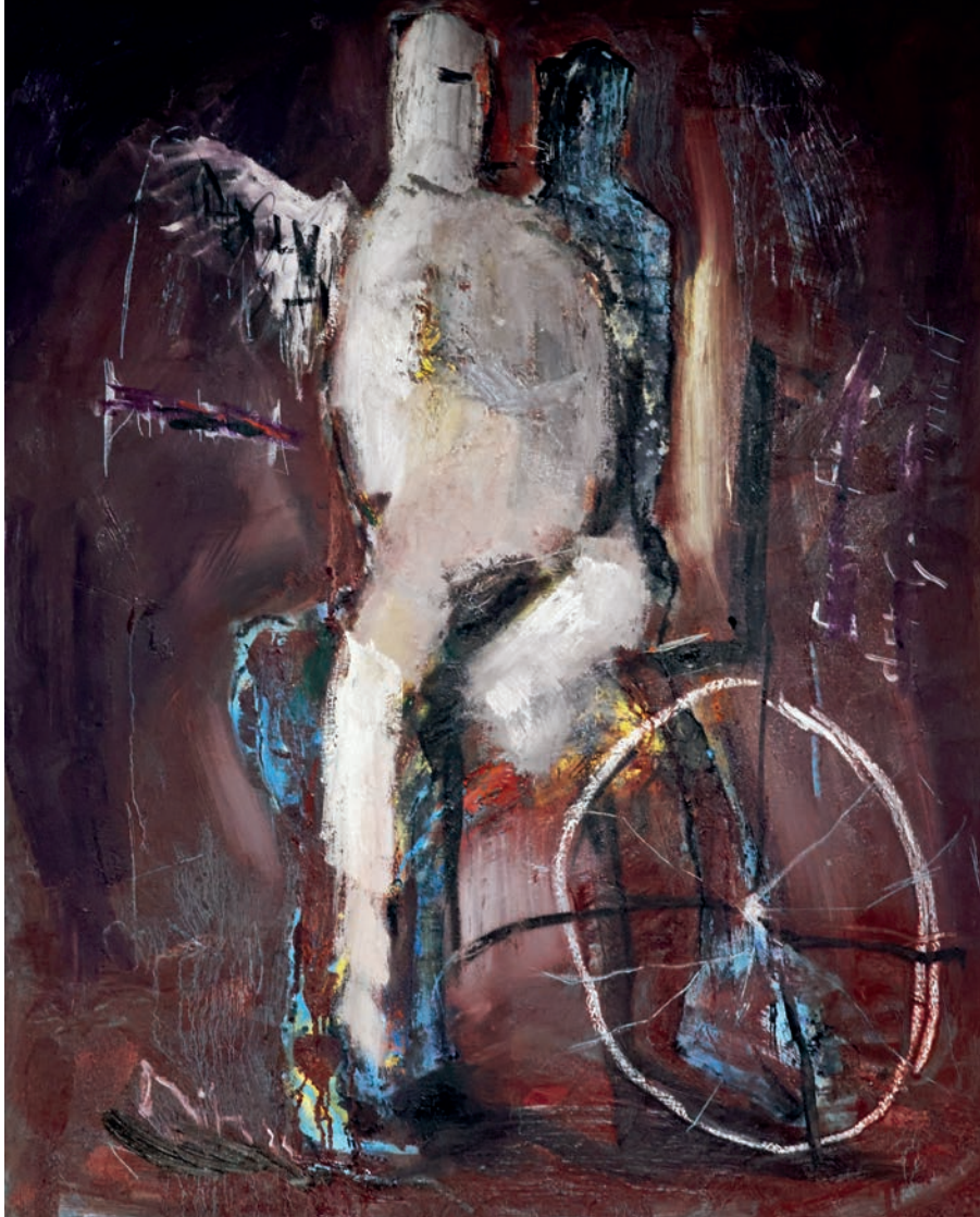
Anstalt 2 2024 Öl auf Leinen 100 x 80 cm