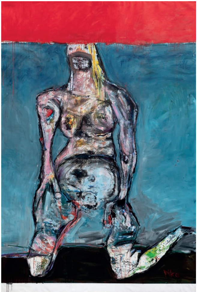
Rote Linie 2023 Öl auf Leinen 300 × 200 cm