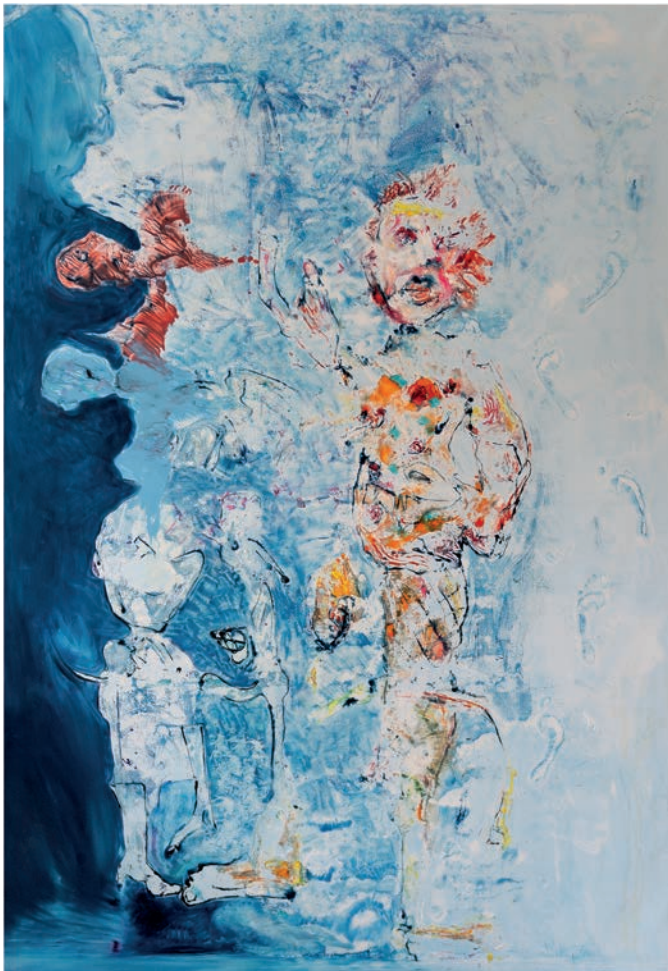
Glaziale, 2023, Öl auf Leinen, 290 × 200 cm