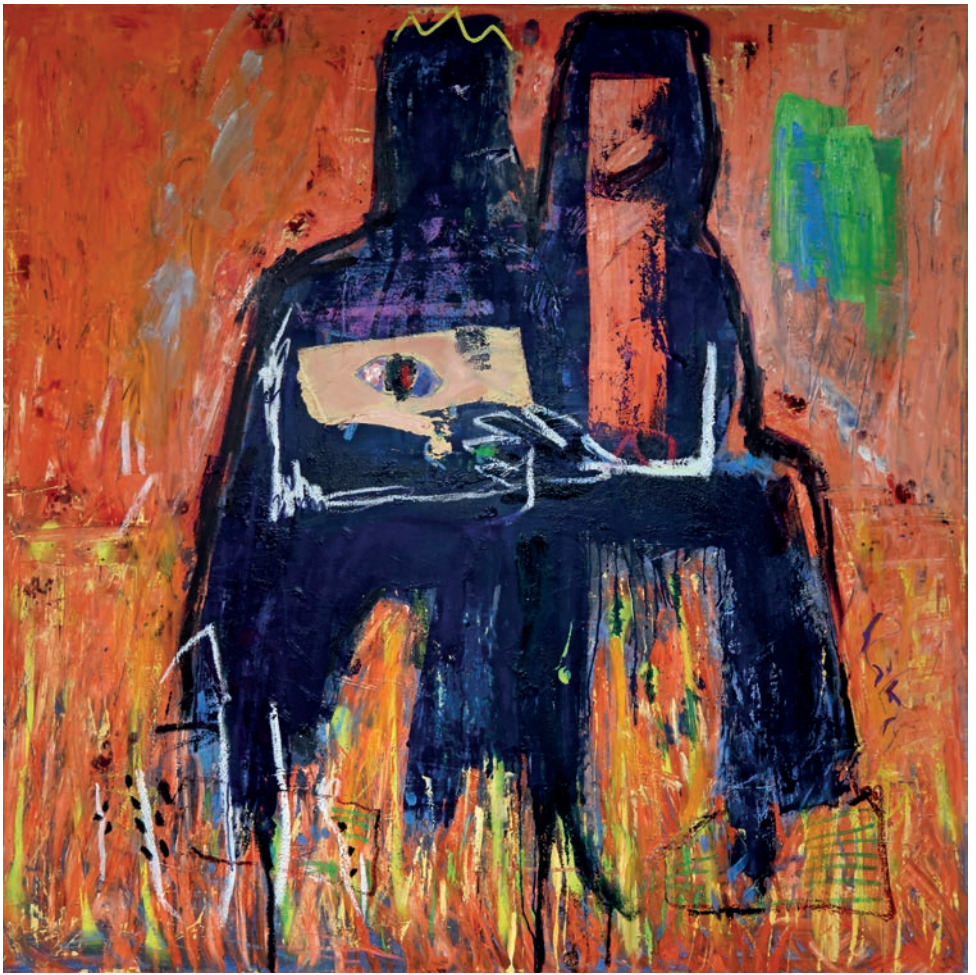
Verführung, 2024, Öl auf Leinen, 150 × 150 cm