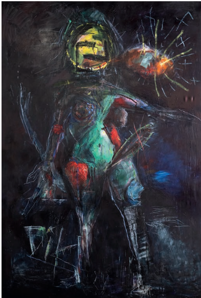
Erscheinung , 2024, Öl auf Leinen, 300 × 200 cm