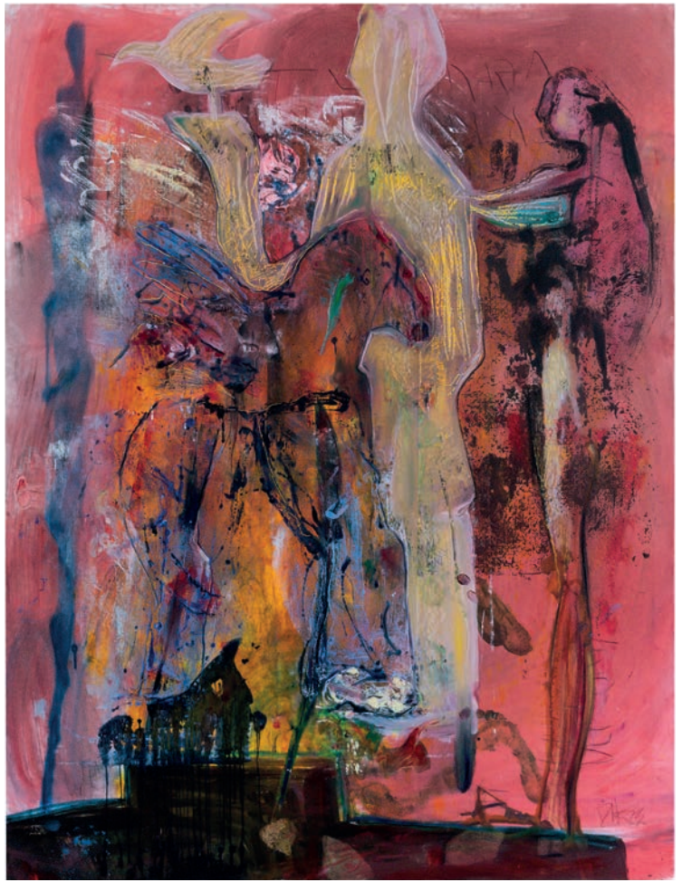
Podium 2023 Öl auf Leinen 200 × 150 cm