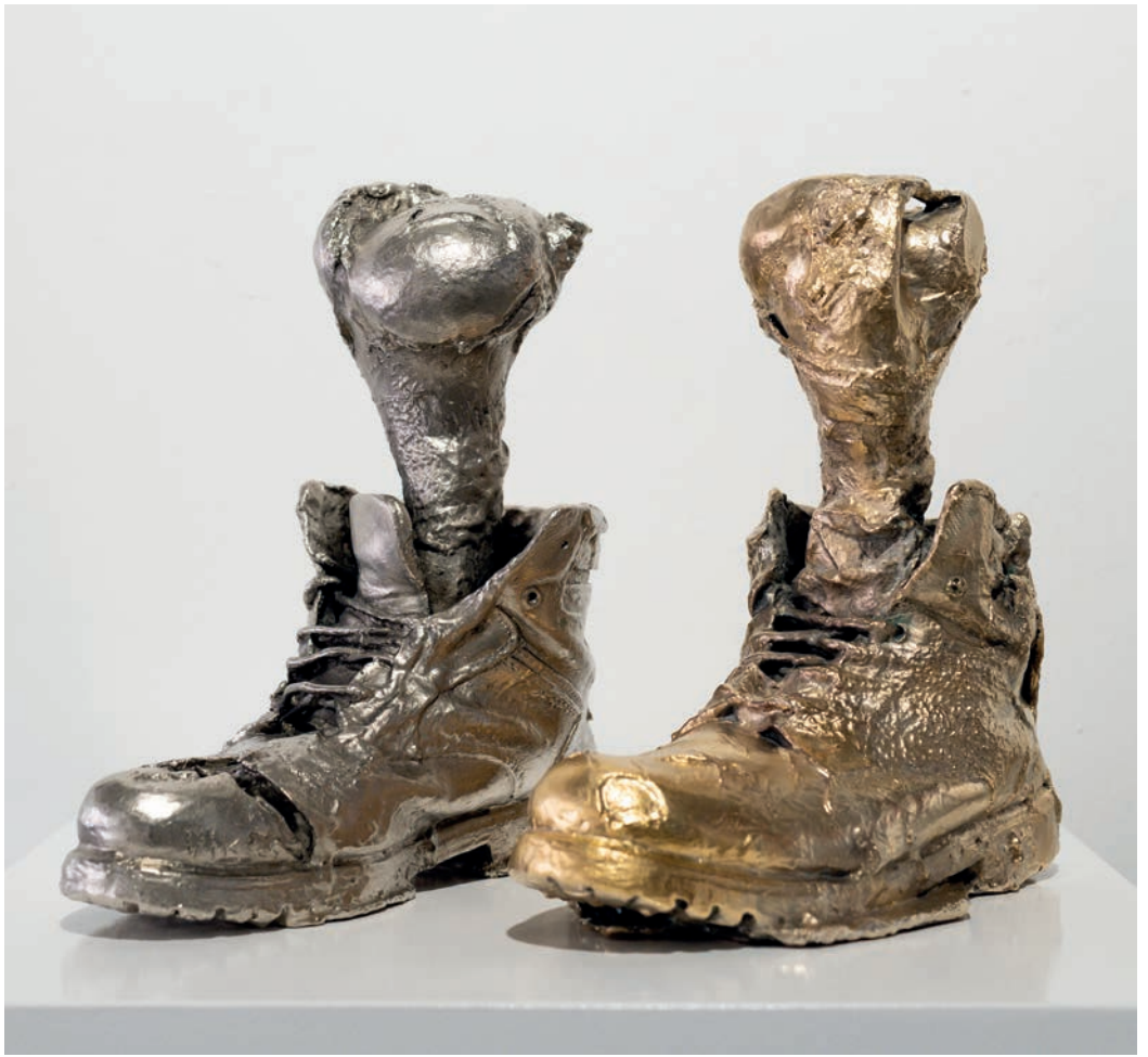
Läufer Paar, 2023, Bronze, A. P. Modelle (+4) Noack Giesserei Berlin Gr. 46