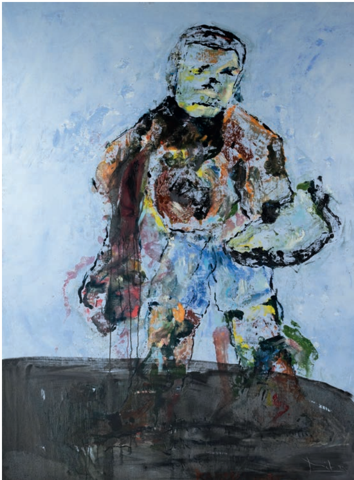
Kampfbefleckt 2024 Öl auf Leinen 200 × 150 cm