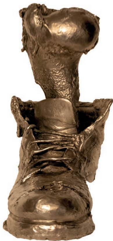
Läufer rechts, 2023, Bronze, Nickel G 46 Noack Giesserei Berlin