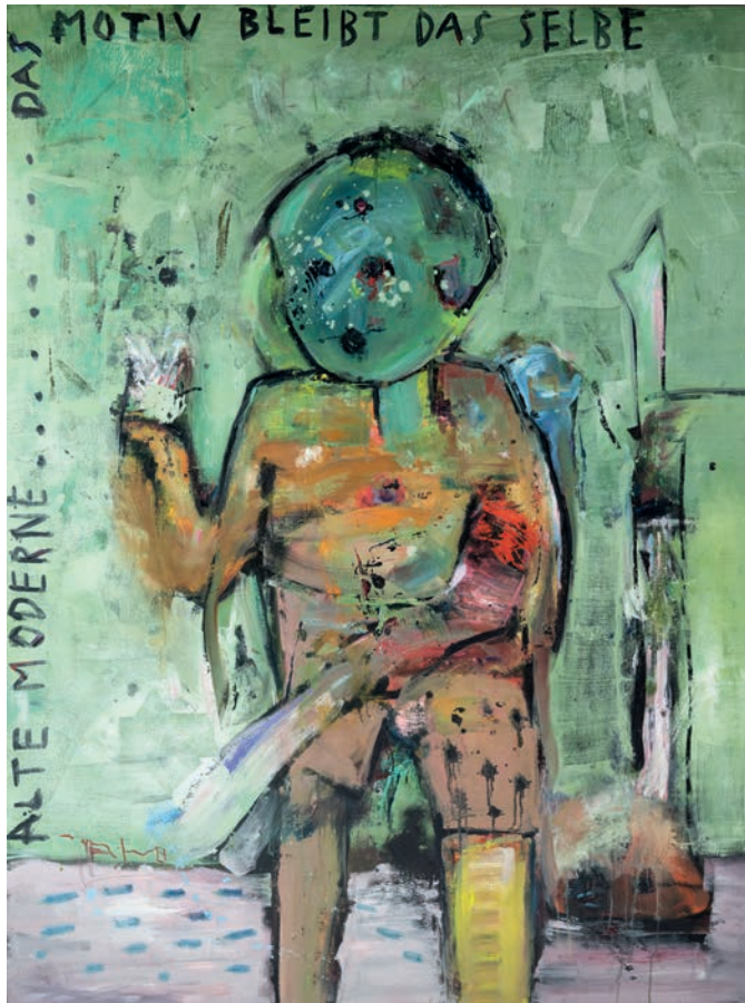
Alte Moderne, 2024, Öl auf Leinen, 200 × 150 cm