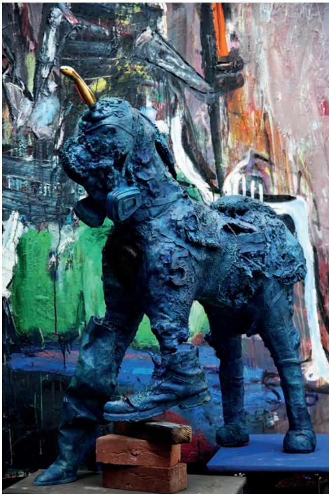
Der 5. Reiter 2024, Bronze, Patina 120 × 110 × 40 cm