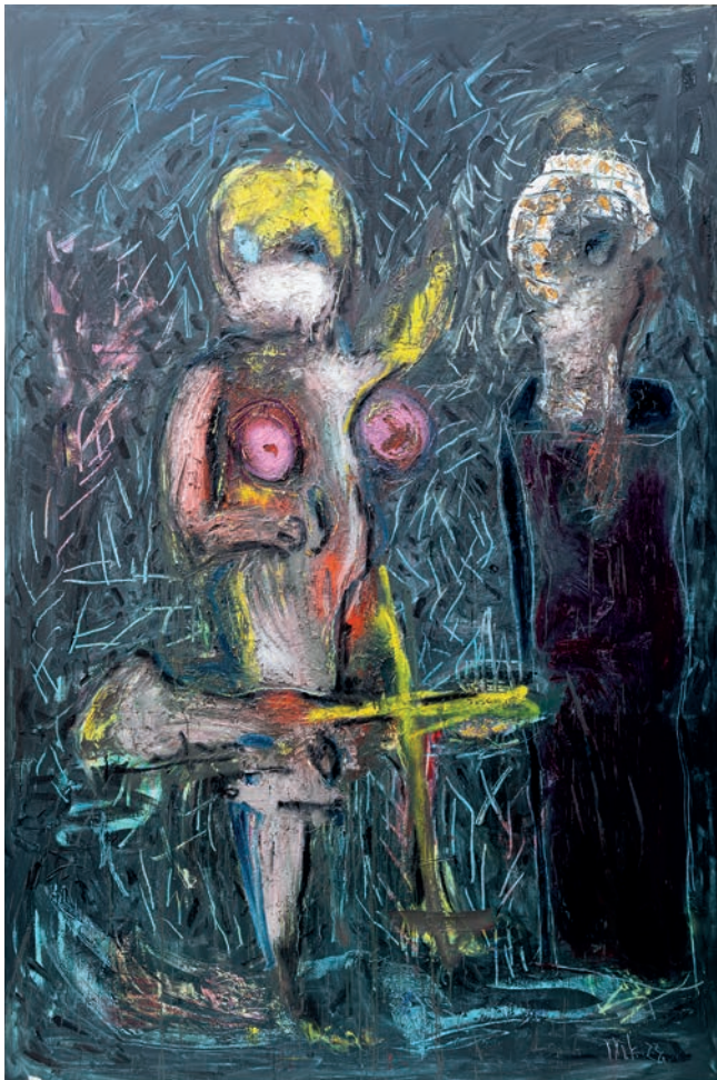
Georg der Bildhauer 2023, Öl auf Leinen 300 × 200 cm