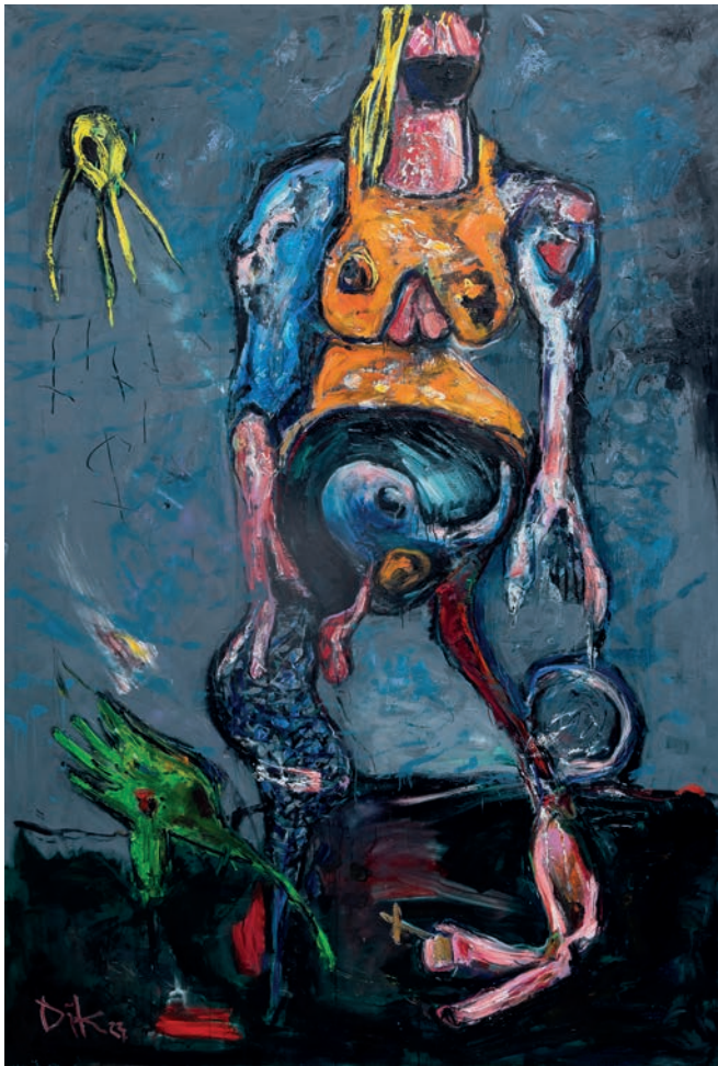
Graue Zone 2023 Öl auf Leinen 300 × 200 cm