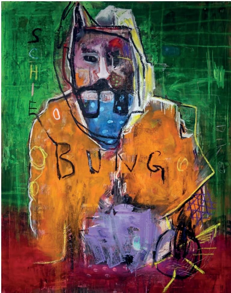
Schiebung 2024 Öl, Pigmente, Sprühfarbe auf Leinen 190 × 150 cm