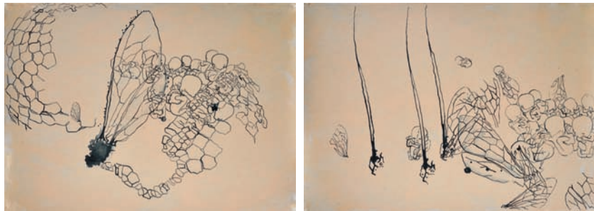
1–2: Samen, 2014, Acryl, Tusche auf Leinwand, 60 × 80 cm