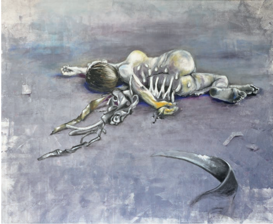
Homophyta 1, 2013, Acryl, Öl auf Leinwand, 115 x 140 cm