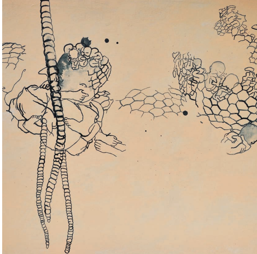
re: Samen, 2014, Acryl, Tusche auf Leinwand, 60 × 80 cm, Detail