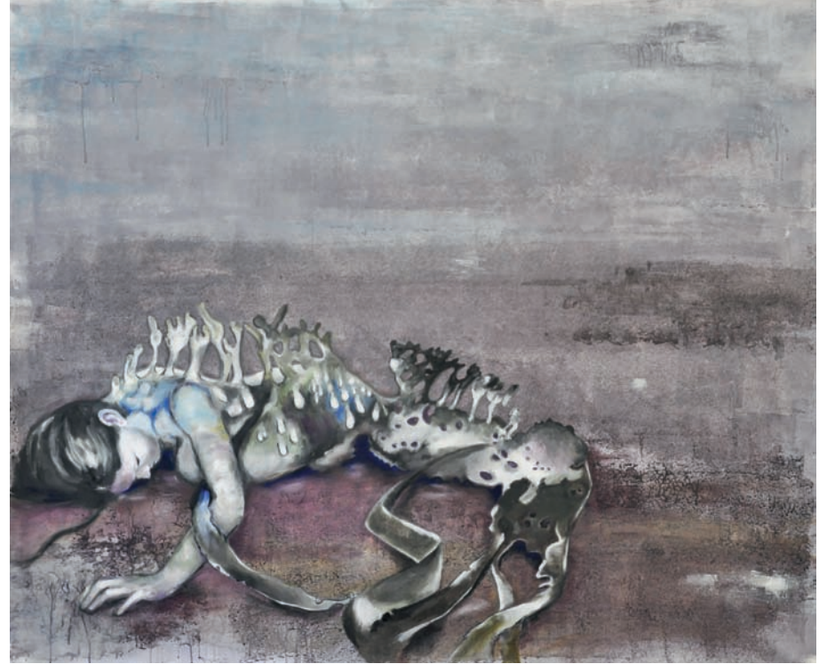
Homophyta 2, 2013, Acryl, Öl auf Leinwand, 115 x 140 cm