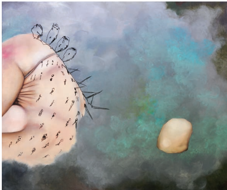
Cereus 3, Werkserie: Fragmen, 2014, Acryl, Öl auf Leinwand, 100 × 120 cm re: Cereus 4, Werkserie: Fragmen, 2014, Acryl, Öl auf Leinwand, 100 × 120 cm, Detail