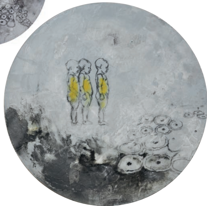
li: Filius 1, 2014, Acryl, Tusche, Wachs, Öl auf Leinwand, Ø 25 cm o: Filius 2, 2014, Acryl, Tusche, Wachs, Öl auf Leinwand, Ø 25 cm u: Filius 3, 2014, Acryl, Tusche, Wachs, Öl auf Leinwand, Ø 40 cm