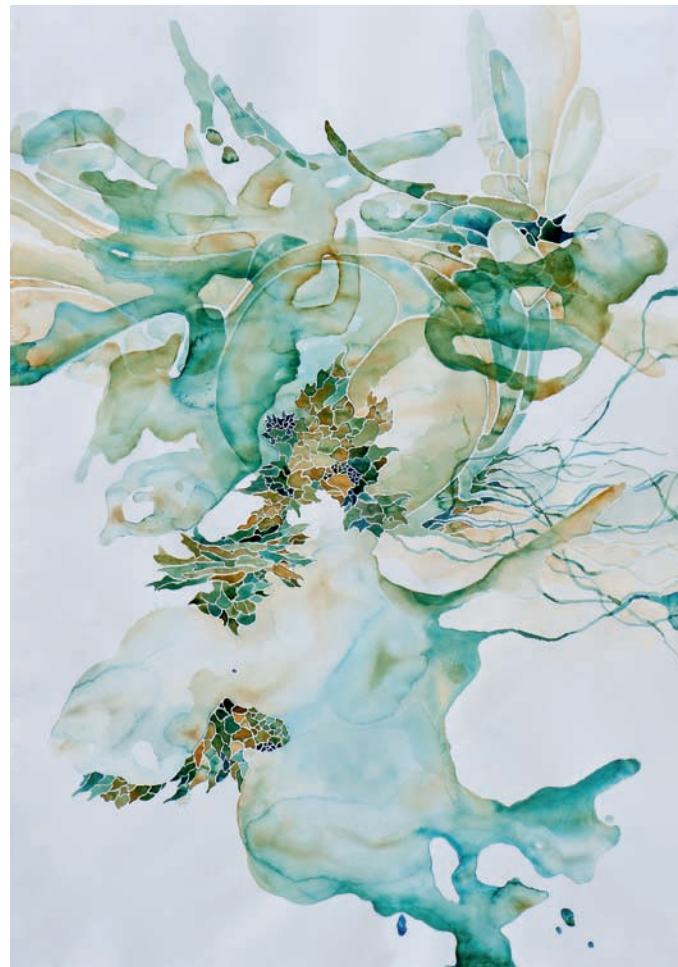
zersetzung im reagenzglas 2013, Aquarell auf Papier, 100 × 75 cm

Ute Wöllmann, Akademieleiterin Berlin, im xxx 2013