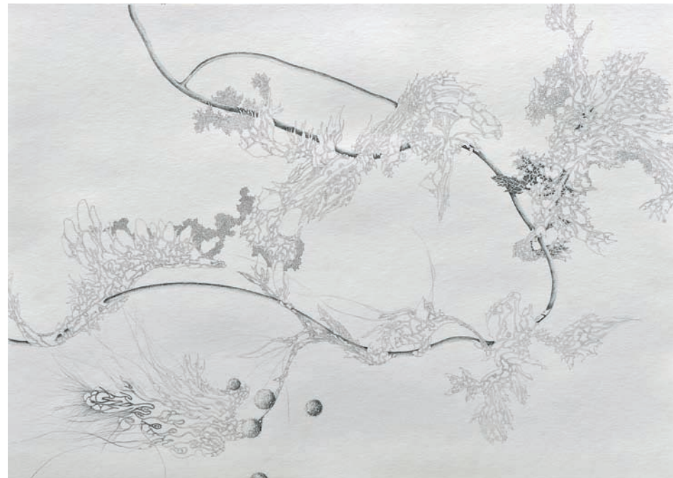
sporen an reaktorwand 2013, Bleistift auf Papier, 70 × 50 cm