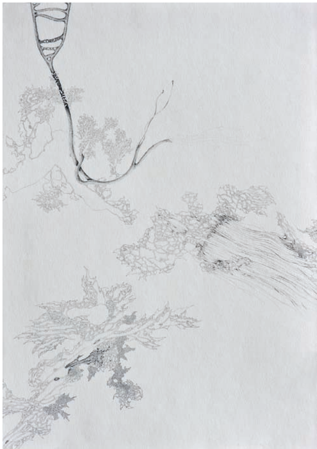
sporen in bodenprobe 20 km vom reaktor 2013, Bleistift auf Papier, 50 × 70 cm