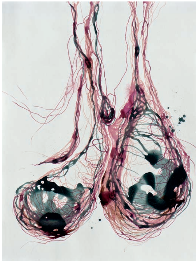
hülle ohne nukleus 2013, Acryl und Tusche auf Papier, 100 × 80 cm