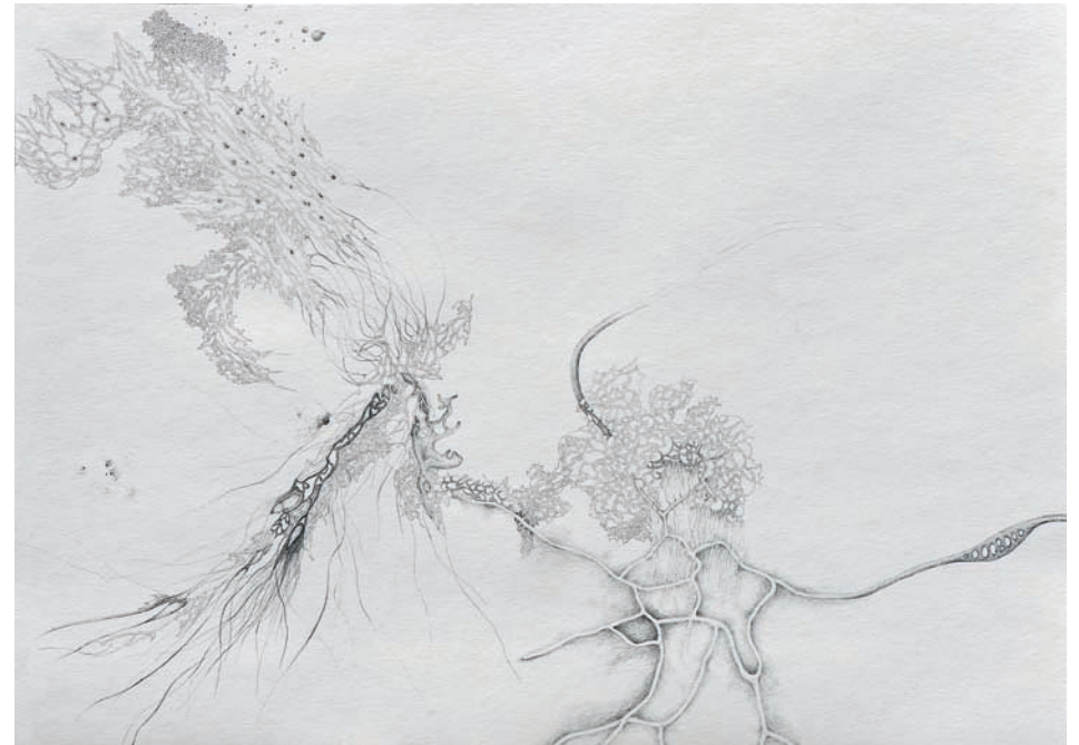
sporen in wasserprobe an reaktor 2013, Bleistift auf Papier, 70 × 50 cm