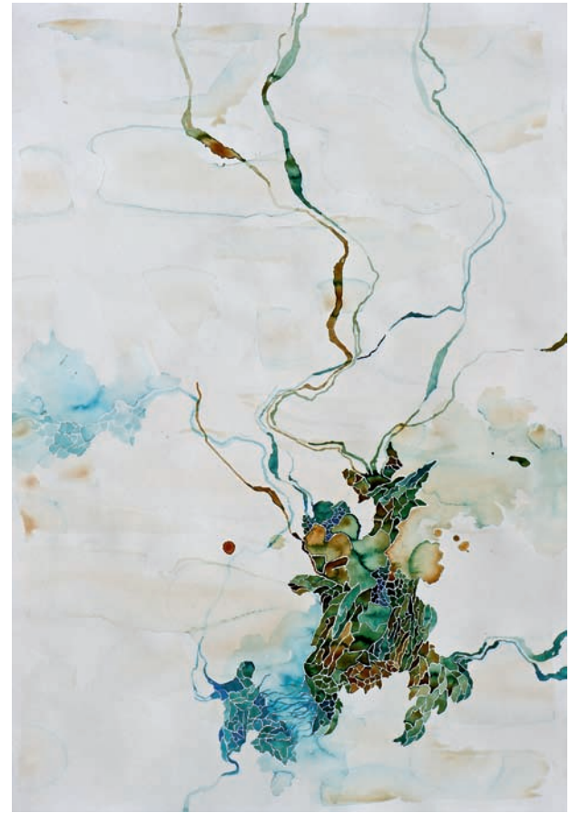
aluminiumblüten 2013, Aquarell auf Papier, 100 x 75 cm