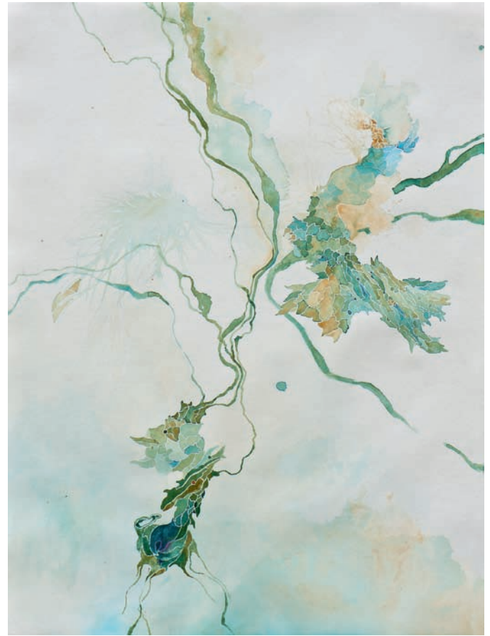
ocker-blau wässriges fleisch 2013, Aquarell auf Papier, 100 × 80 cm