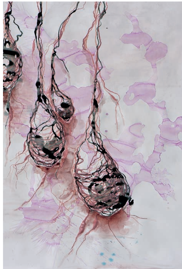
atmet ohne adern aus dem innern 2013, Acryl, Aquarell und Tusche auf Papier, 100 × 75 cm