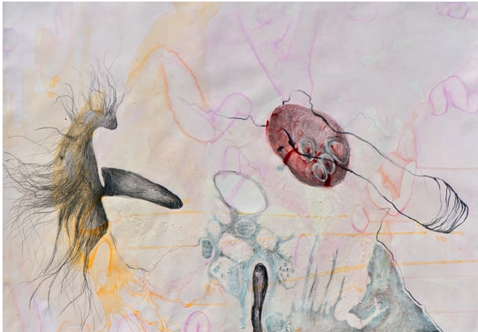
Zellkern geflecht ohne haut 2013, Acryl, Aquarell, Graphit und Tusche auf Papier, 75 × 100 cm