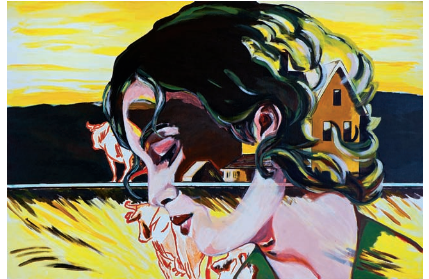
was vom Tage übrig blieb 2011, Acryl auf Leinwand, 80 x 120 cm