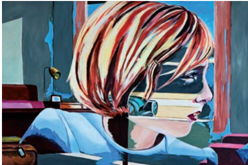
der Schein trügt 2010, Acryl auf Leinwand, 80 x 120 cm