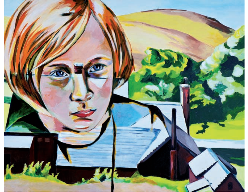
allein auf weiter Flur 2011, Acryl auf Leinwand, 80 x 100 cm