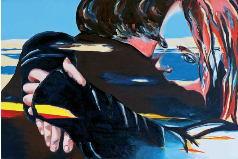
glückliche Momente 2010, Acryl/Strukturpaste auf Leinwand, 80 x 120 cm