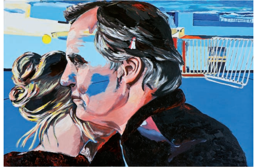
Sehnsucht 2010, Acryl auf Leinwand, 80 x 120 cm