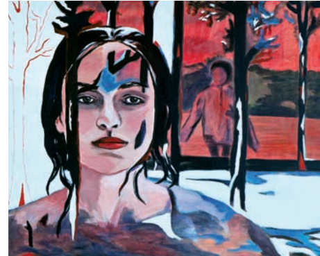
unter Beobachtung 2010, Acryl auf Leinwand, 80 x 100 cm