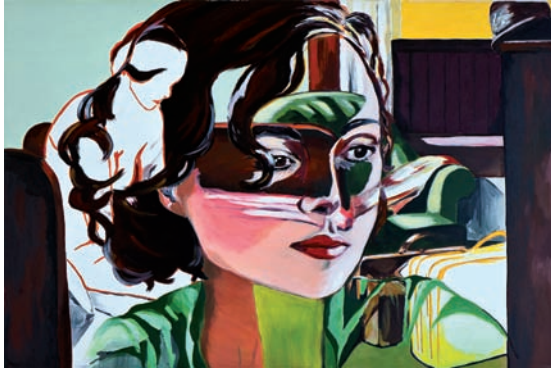
die Gedanken so frei 2011, Acryl auf Leinwand, 80 x 100 cm