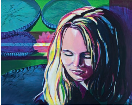
Grübeleien 2009, Acryl auf Leinwand, 80 x 100 cm