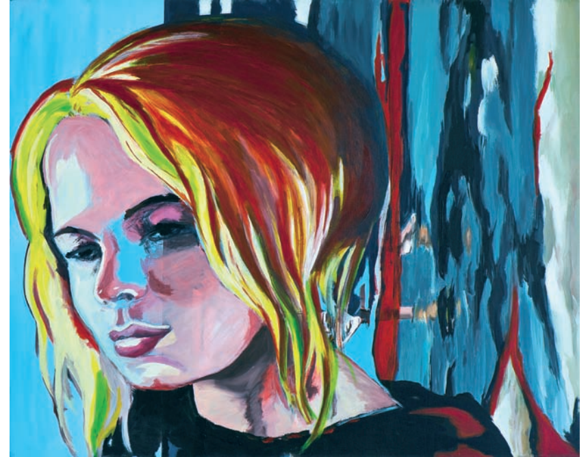
Selbstzweifel 2009, Acryl auf Leinwand, 80 x 100 cm