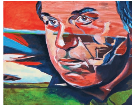
Erwartung 2010, Acryl auf Leinwand, 80 x 100 cm