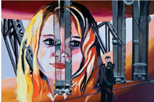
Abschied 2010, Acryl auf Leinwand, 80 x 120 cm