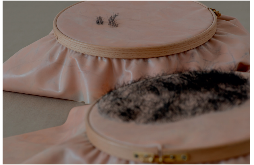
Verpflanzung 2013, Echthaar auf Silikon, Schminke, Stickrahmen, zweiteilig je Ø 25 cm