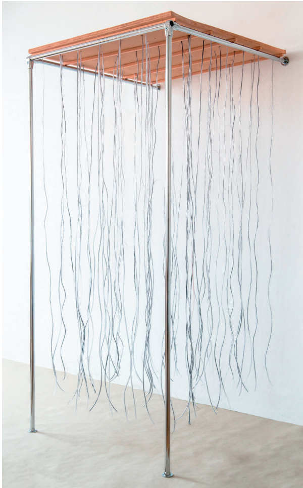
Kontakt 2012, Echthaar, Plastik, Schaumstoff, Chrom, 100 × 100 × 200 cm