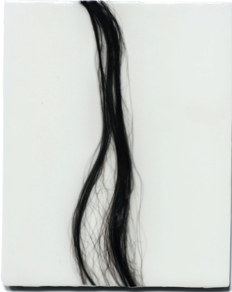
Absence II 2012, Echthaar, Paraffin auf MDF, 24 × 30 cm