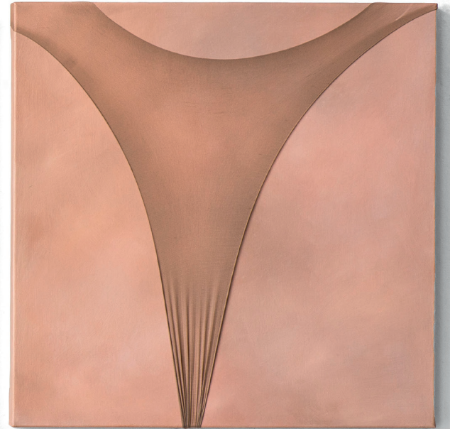
Körperkultur 2013, Öl auf Leinwand, Nylon, dreiteilig je 50 × 50 cm