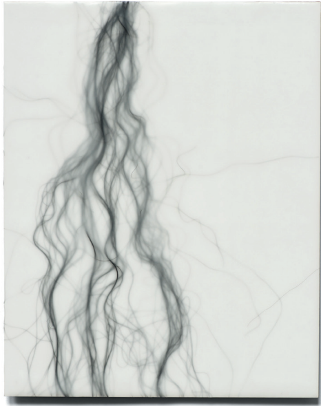
Absence III 2012, Echthaar, Paraffin auf MDF, 24 × 30 cm