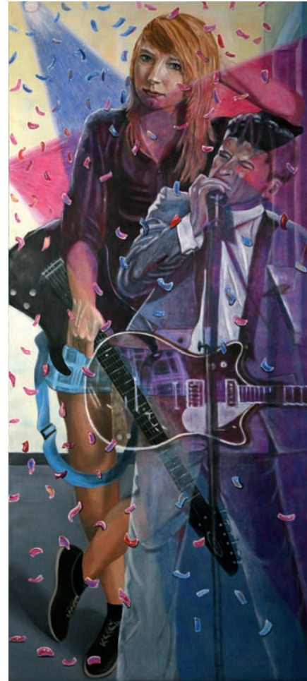
Vision 2 2012, Öl auf Leinwand, 180 × 80 cm