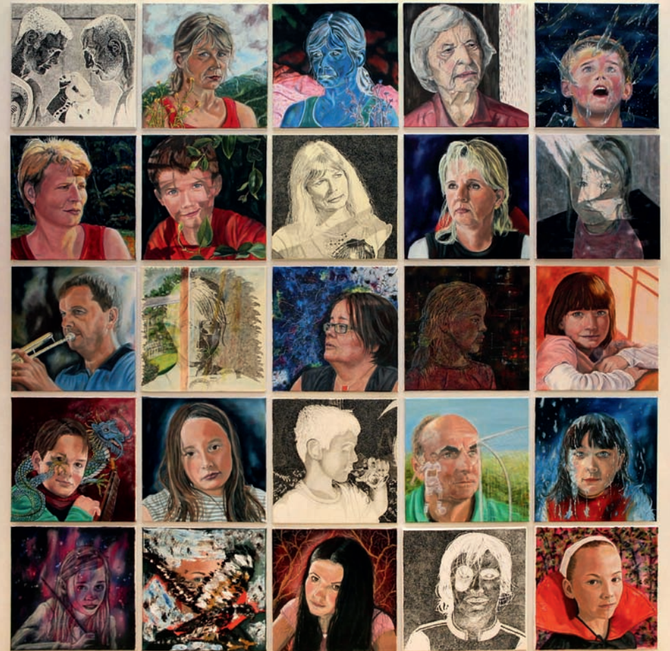
Kopf hautnah 2012, unterschiedliche Techniken, 25 Arbeiten, 208 × 208 cm