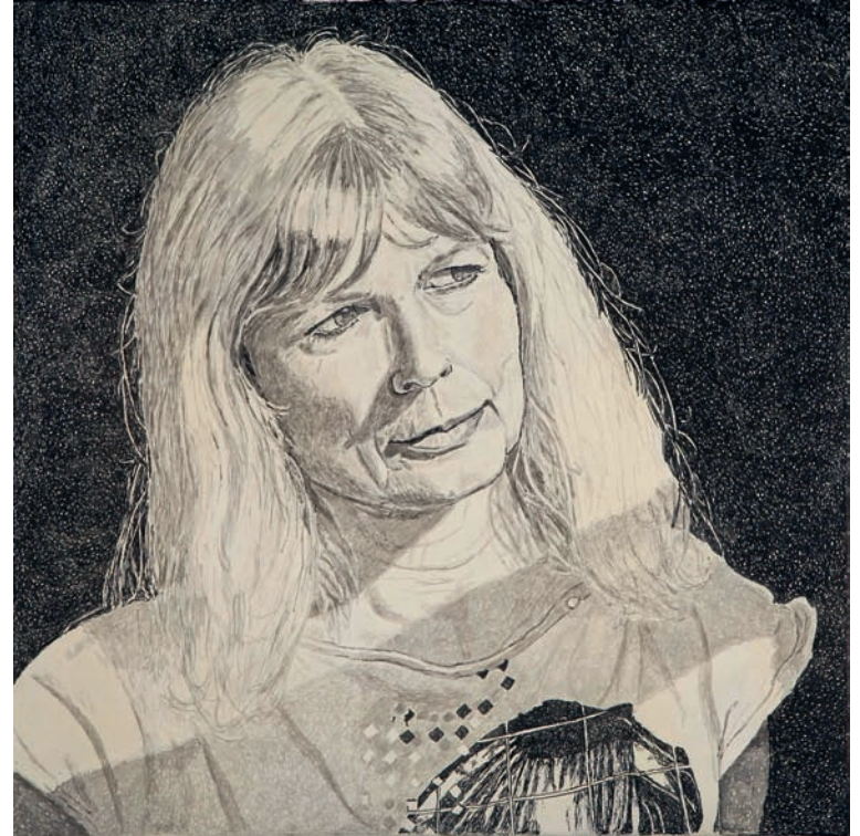
Lichthell 2012, Tusche auf Leinwand, 40 x 40 cm