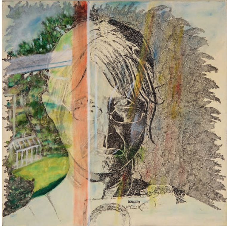
Gartentraum 2012, Öl auf Leinwand, 40 × 40 cm rechts: Zwiespalt 2011, Öl auf Leinwand, 200 × 180 cm