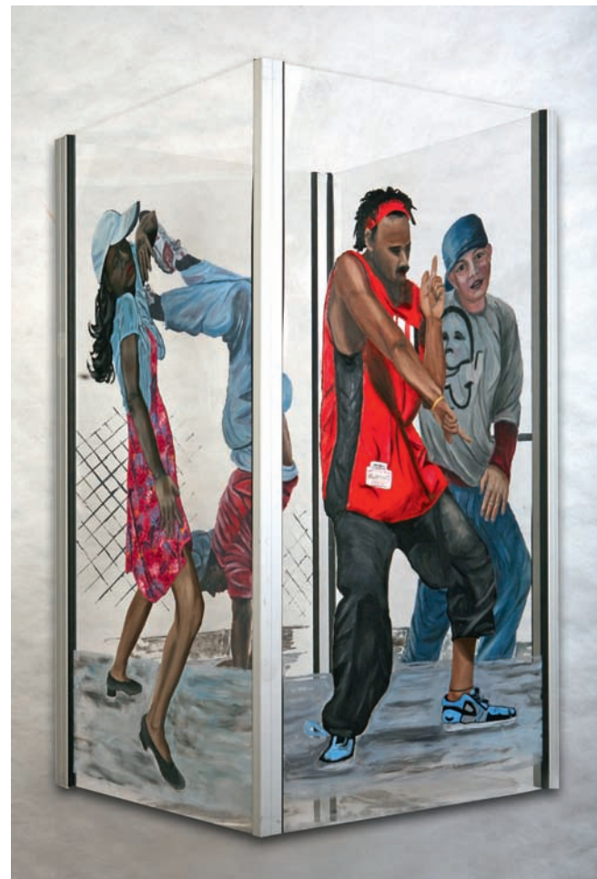
Breakdance 2011, Objekt, Öl auf Acrylglas, vier Ansichten je 100 × 50 cm