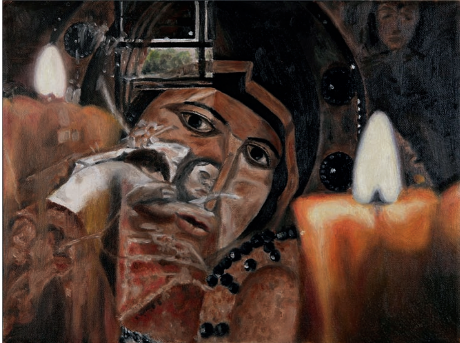
Behütet 2010, Öl auf Leinwand, 30 x 40 cm