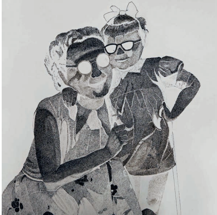
Lebensgeschichte 2012, Tusche auf Papier, 100 × 1000 cm