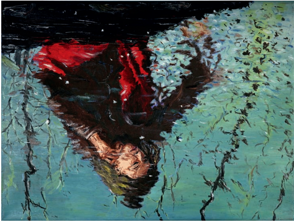
Selbstporträt 2009, Öl auf Nessel, 30 × 40 cm