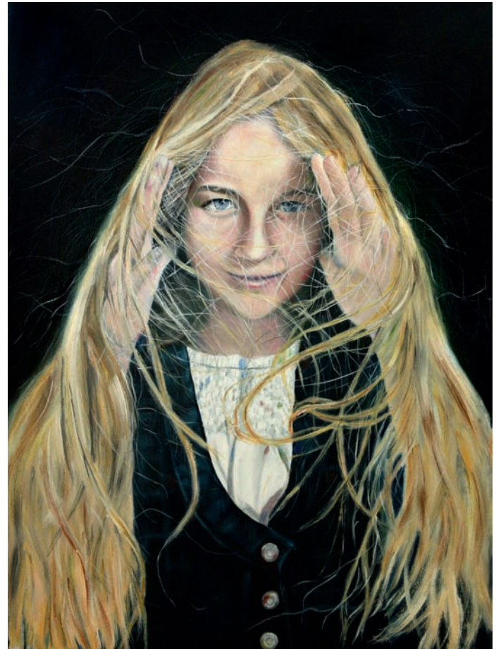
Lina 2011, Öl auf Leinwand, 80 × 60 cm