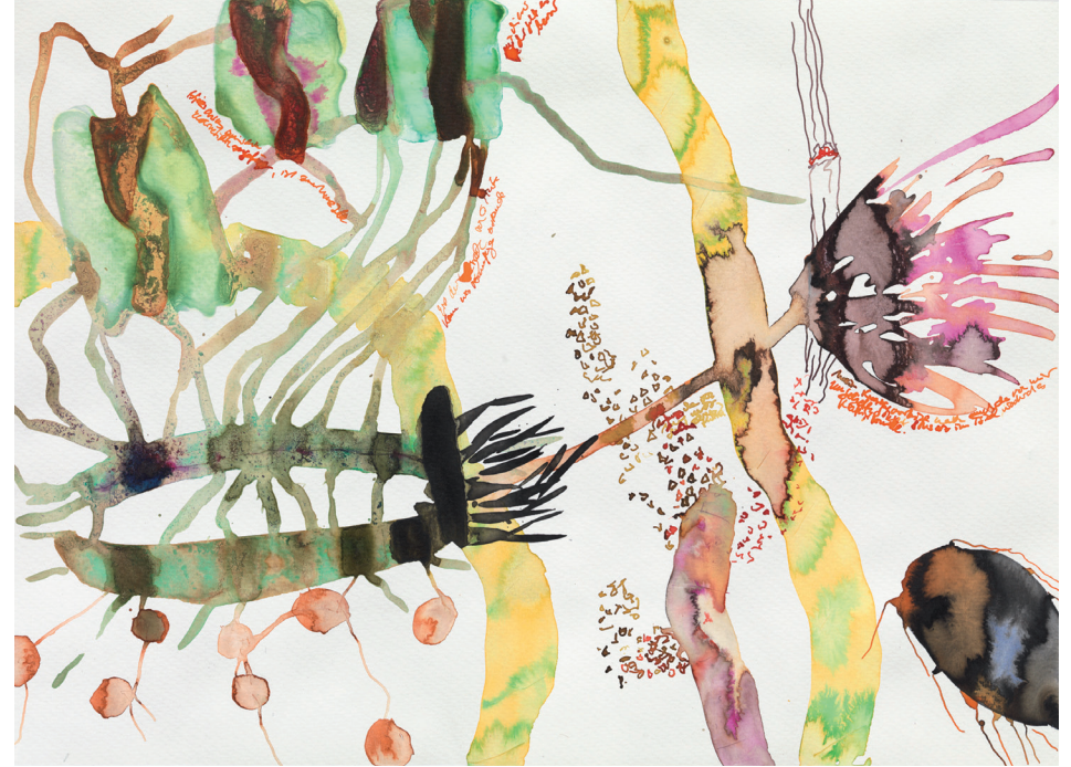
Pflanzliches VI 2012, Tusche auf Papier, 35,5 × 47,5 cm