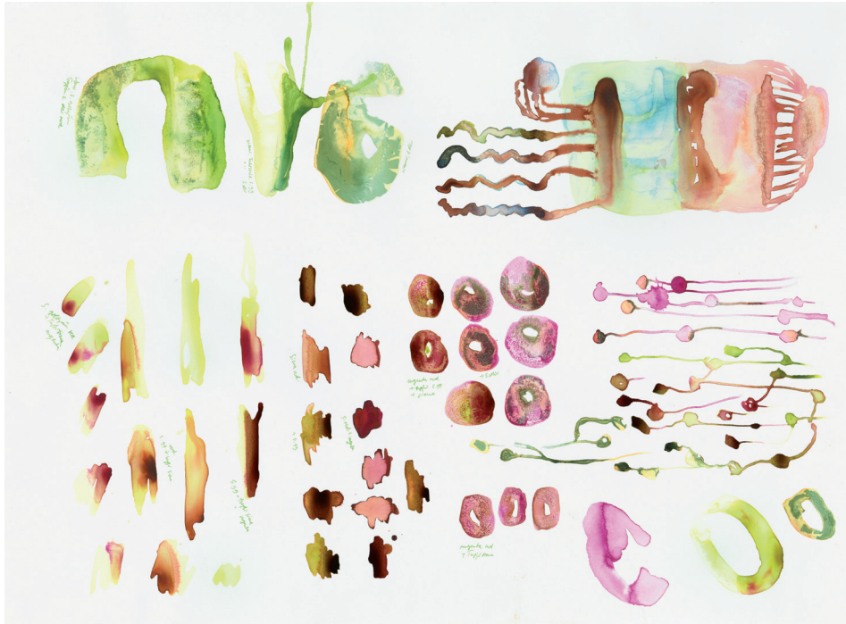
Modulation III 2012, Tusche auf Papier, 56 × 76,5 cm