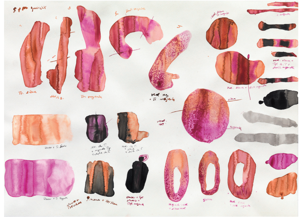
Modulation V 2012, Tusche auf Papier, 36 × 47,8 cm