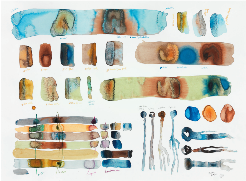
Modulation IV 2012, Tusche auf Papier, 56 × 76,5 cm