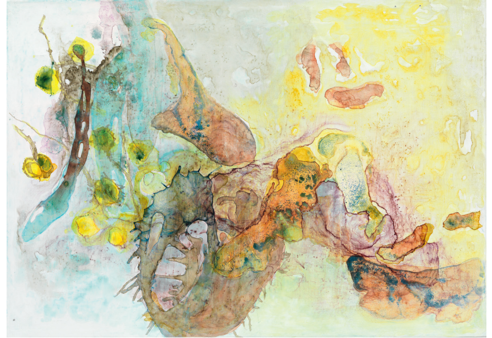
Herbstliches 2012, Tusche auf Leinwand, 50 × 70 cm