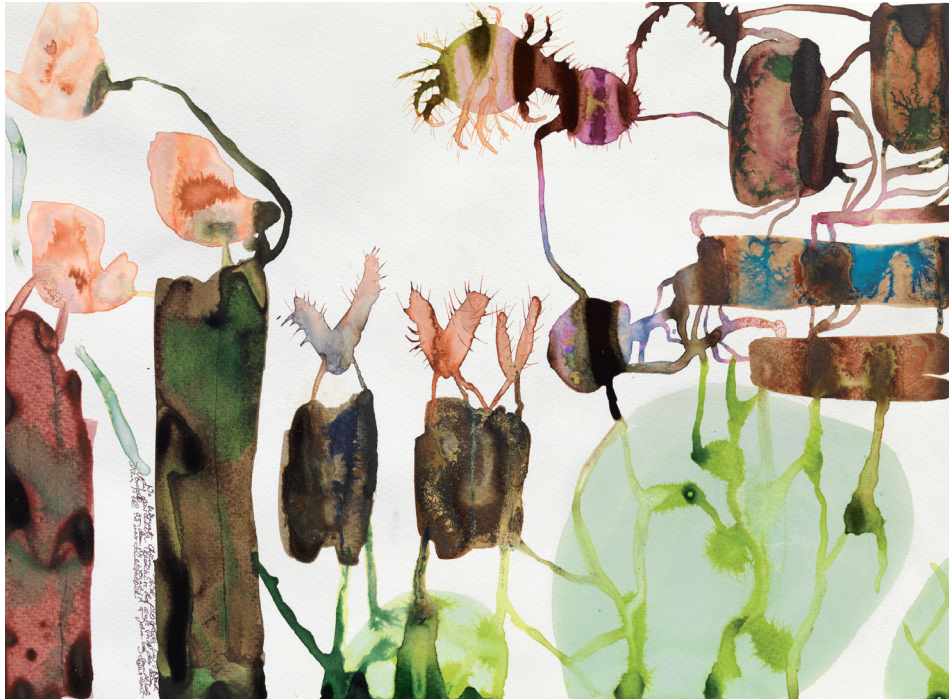
Pflanzliches V 2012, Tusche auf Papier, 35,5 × 47,6 cm