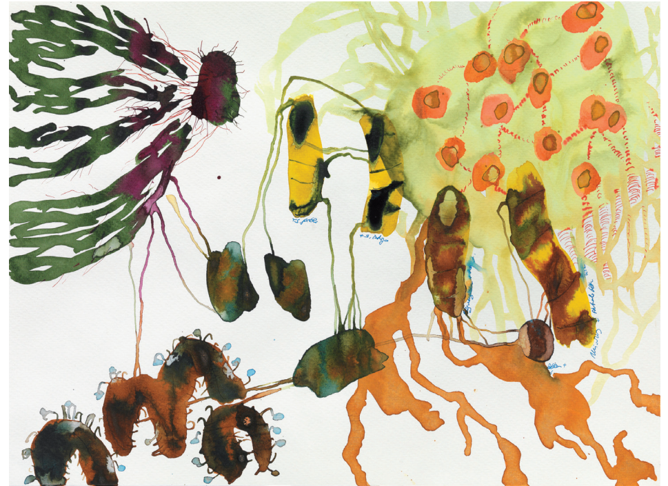
Pflanzliches VII 2012, Tusche auf Papier, 35,8 × 47,7 cm