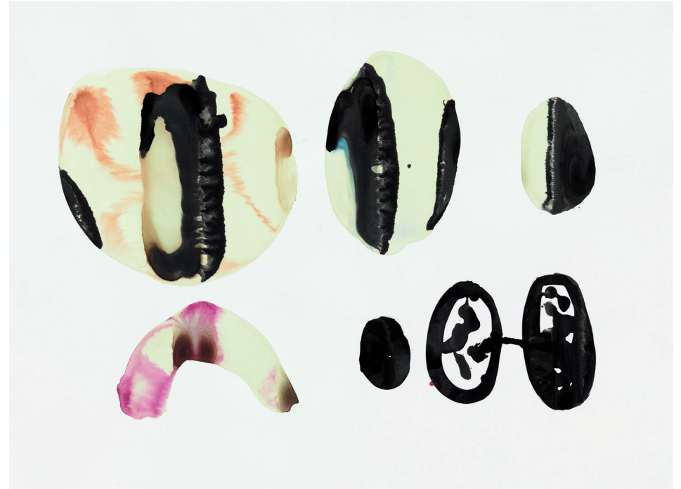
Modulation II 2012, Tusche auf Papier, 56 × 76,5 cm