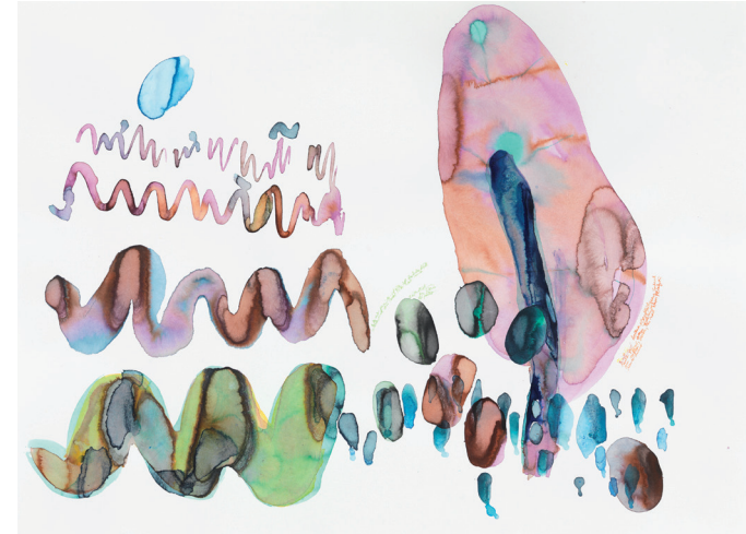
Modulation VI, 2012, Tusche auf Papier, 56 × 76,5 cm

Ebenso intensiv hat sich Evelyn Werhahn während des Studiums mit Fragen der Komposition auseinandergesetzt. Diese Untersuchungen fanden in der Gemäldegalerie in Berlin statt und entließen sie mit hohen Anforderungen an ihre eigenen Bildkompositionen. Dies und die Erkenntnisse aus ihren Forschungsreihen zur Tusche hat Evelyn Werhahn in zahlreichen Werkserien einfließen lassen, die sich fast ausschließlich mit Pflanzen auseinandersetzen. Mit einem feinen und sensitiven Farbgespür setzt Evelyn Werhahn die beobachteten pflanzlichen Strukturen und Formen in ein reich verdichtetes Bildgefüge um. Sie zieht dabei alle Register ihres malerischen und kompositorischen Farbgespürs, nichts ist dem Zufall überlassen.