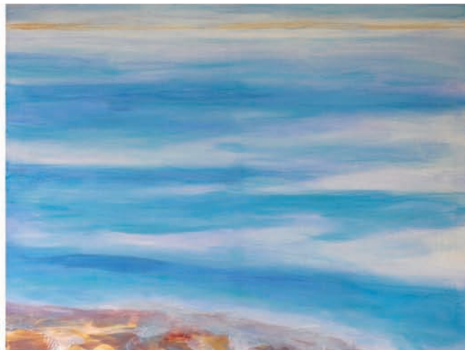
Ende eines Sonnenbads 2011, Acryl auf Leinwand, Triptychon 60 x 240 cm