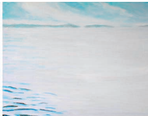
Netzwaschen an der Riva 2010, Acryl auf Leinwand, Diptychon, 60 x 160 cm