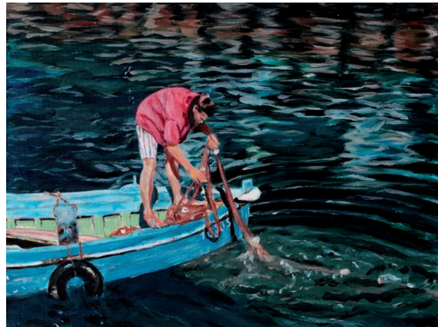
Netzewaschen 2009, Acryl auf Leinwand, 30 x 40 cm