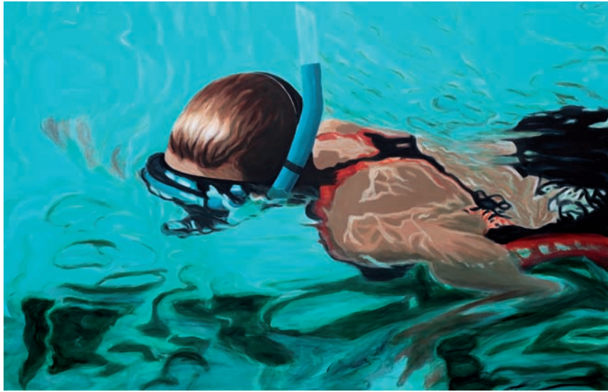
Schnorchlerin 2011, Acryl auf Leinwand, 120 × 190 cm