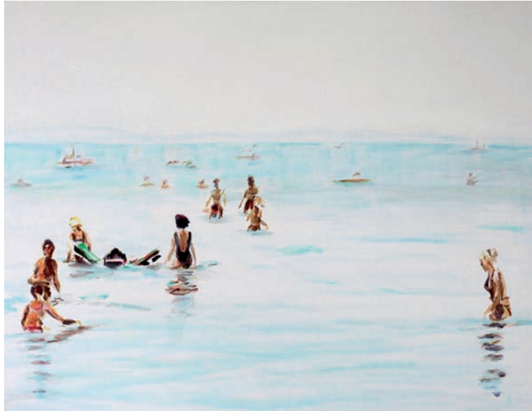
Am Meer 2010, Acryl auf Leinwand, 70 × 90 cm