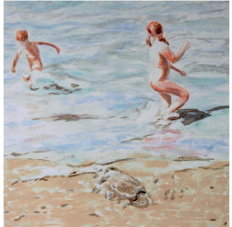
Fangspiel im Wattenmeer 2011, Acryl auf Leinwand, 80 × 80 cm