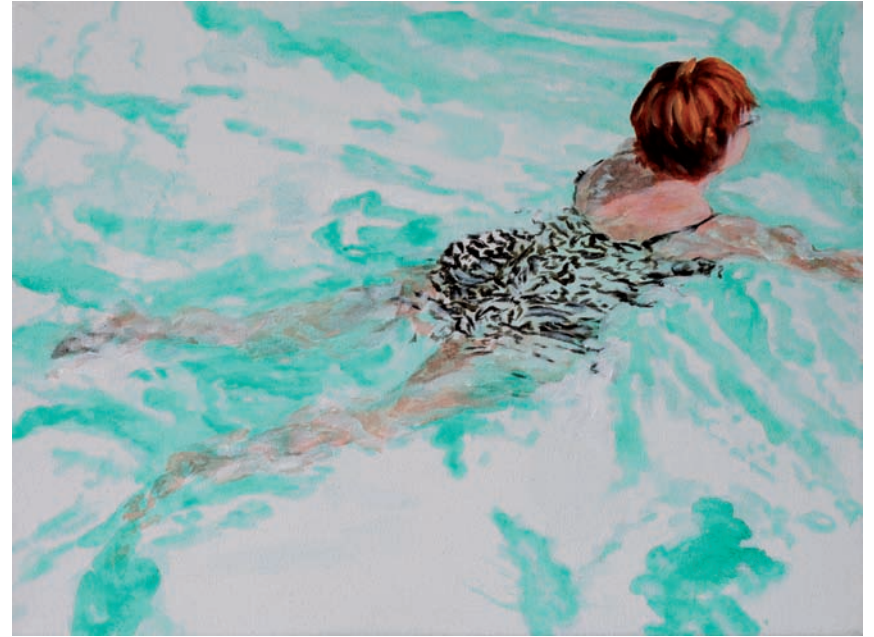
Schwimmende III 2011, Acryl auf Leinwand, 30 × 40 cm