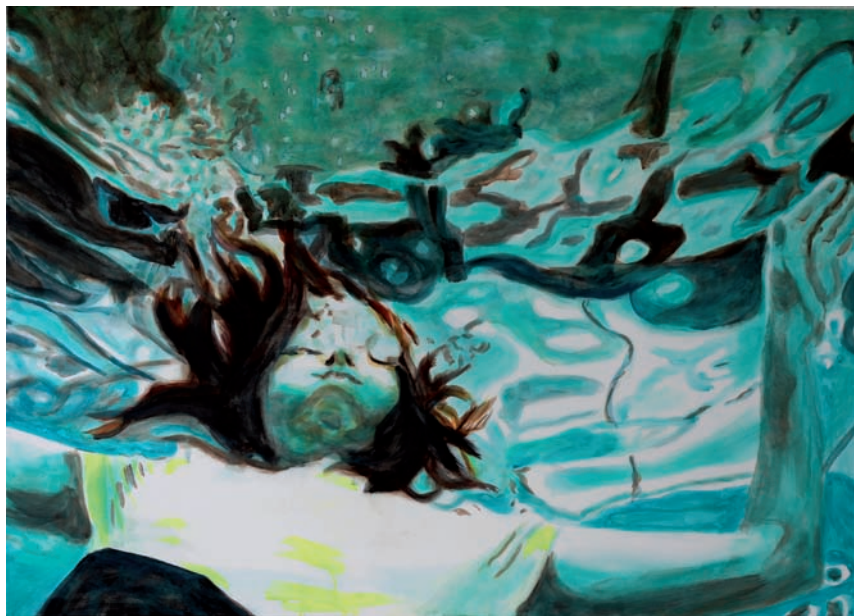
Mädchen unter Wasser 2011, Acryl auf Leinwand, 100 x 140 cm