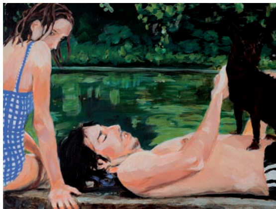
Paar mit Hund 2009, Acryl auf Leinwand, 30 × 40 cm