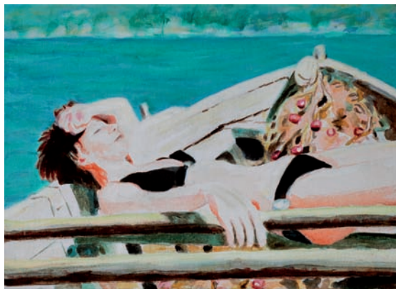
Sonnenbadende 2010, Acryl auf Leinwand, 25 × 35 cm