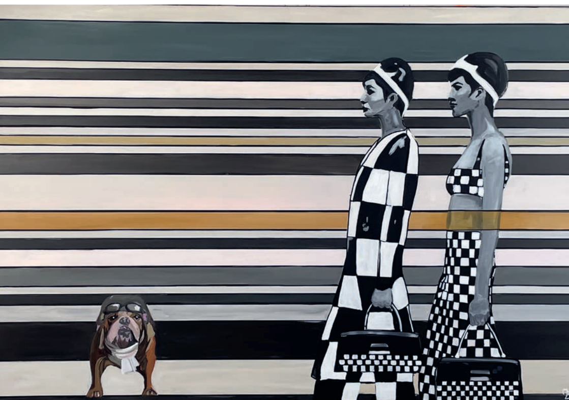
Wohin laufen sie? 3, 2024, Acryl auf Leinwand, 100 × 150 cm