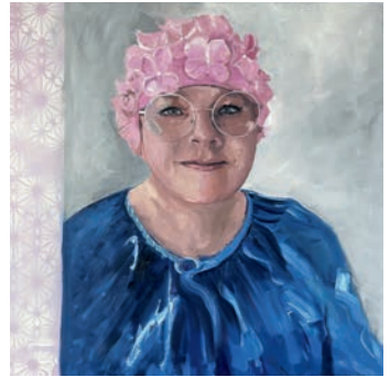
Karin-Isabel Öl auf Leinwand, 60 × 60 cm Daddls Öl auf Leinwand, 60 × 60 cm