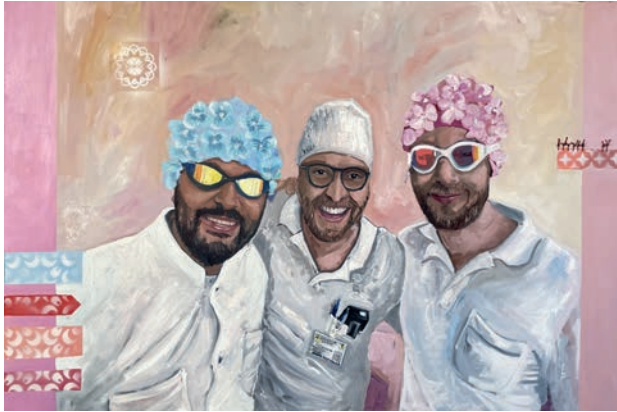
oben: Schichtwechsel , 2025, Öl auf Leinwand, 80 × 120 cm