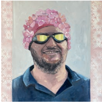
Addi Öl auf Leinwand, 60 × 60 cm Kai Öl auf Leinwand, 60 × 60 cm