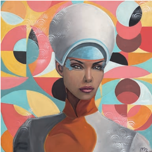
Luna , 2023, Öl auf Leinwand, 100 × 100 cm