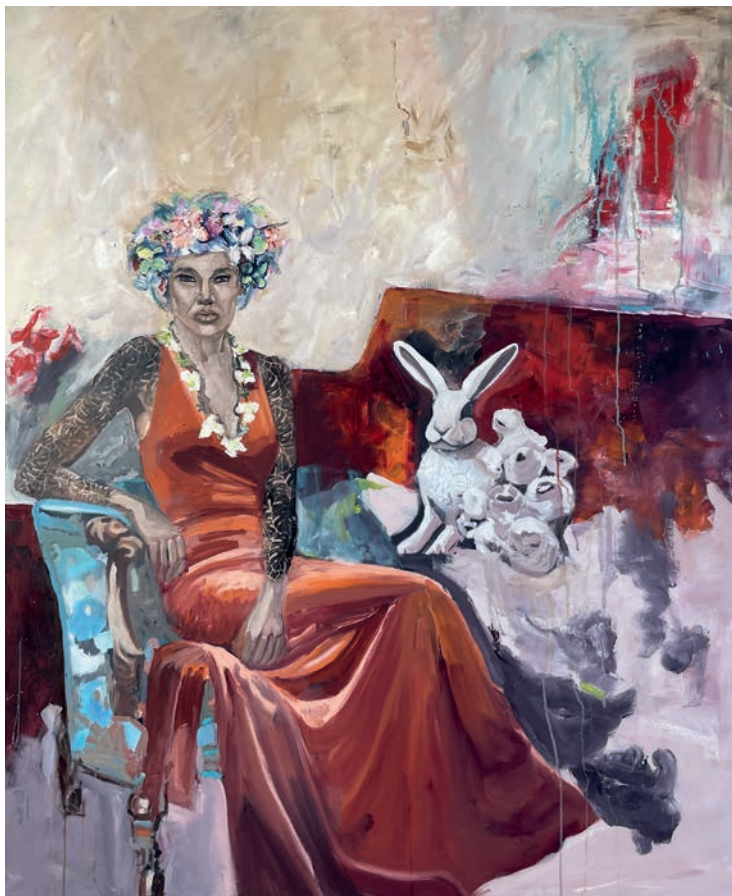
laorana. Polynesien- Weltreise, 2025 Öl auf Leinwand 120 × 100 cm