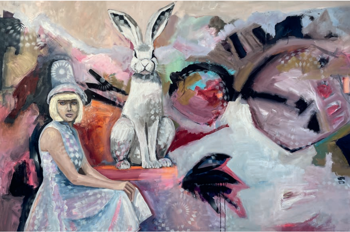
Alice in Europa, Weltreise, 2025, Öl auf Leinwand, 115 × 175 cm