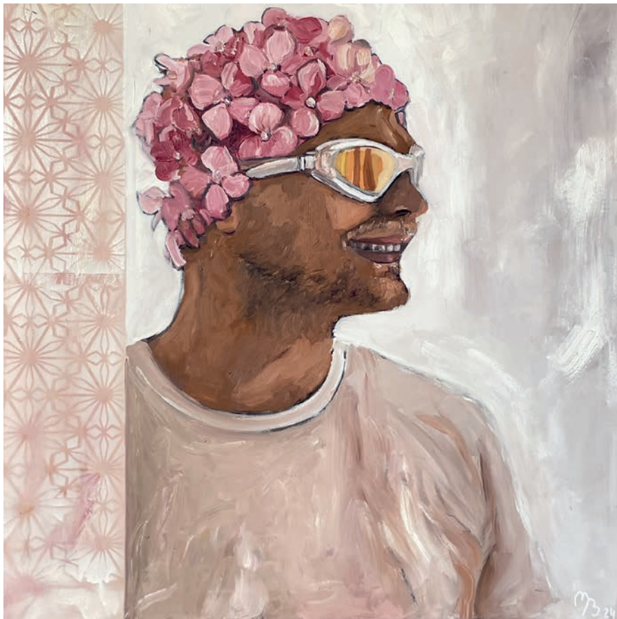
oben: Schatzi , 2024, Öl auf Leinwand, 60 × 60 cm