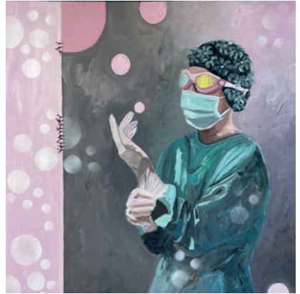
links: Ein Arzt für alle Fälle , 2025, Öl auf Leinwand, 120 × 130 cm