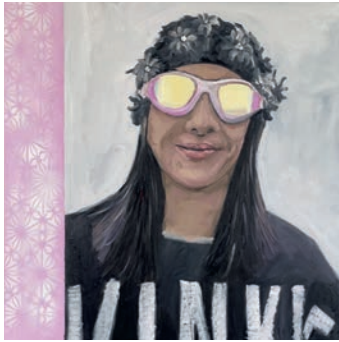
Ay Tieta Öl auf Leinwand, 60 × 60 cm Hatty Öl auf Leinwand, 60 × 60 cm