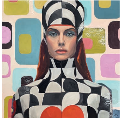
Medisson , 2023, Öl auf Leinwand, 100 × 100 cm