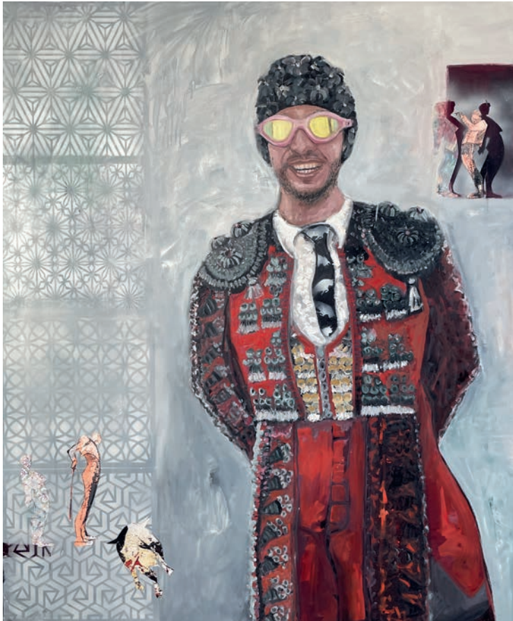
New Art des Stierkampfes, 2025, Öl-/Mischtechnik auf Leinwand, 120 × 100 × 4 cm