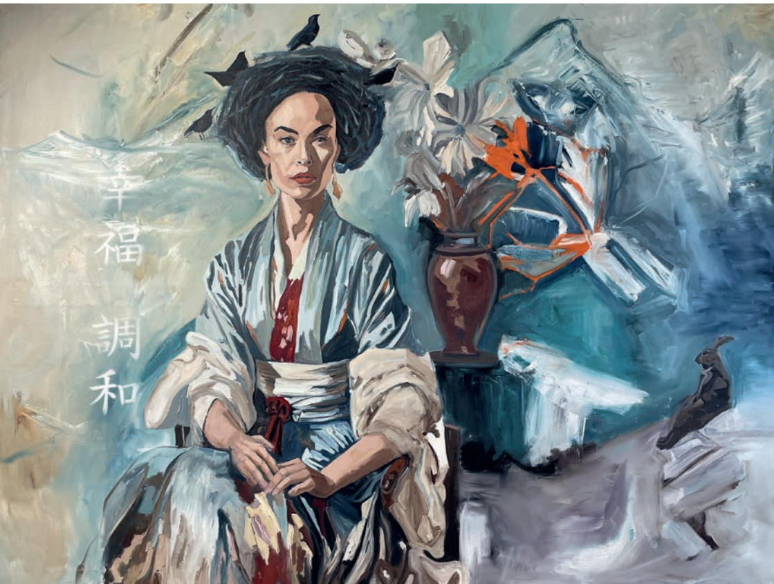
Glück und Harmonie. Japan-Weltreise, 2025, Öl auf Leinwand, 120 × 160 cm