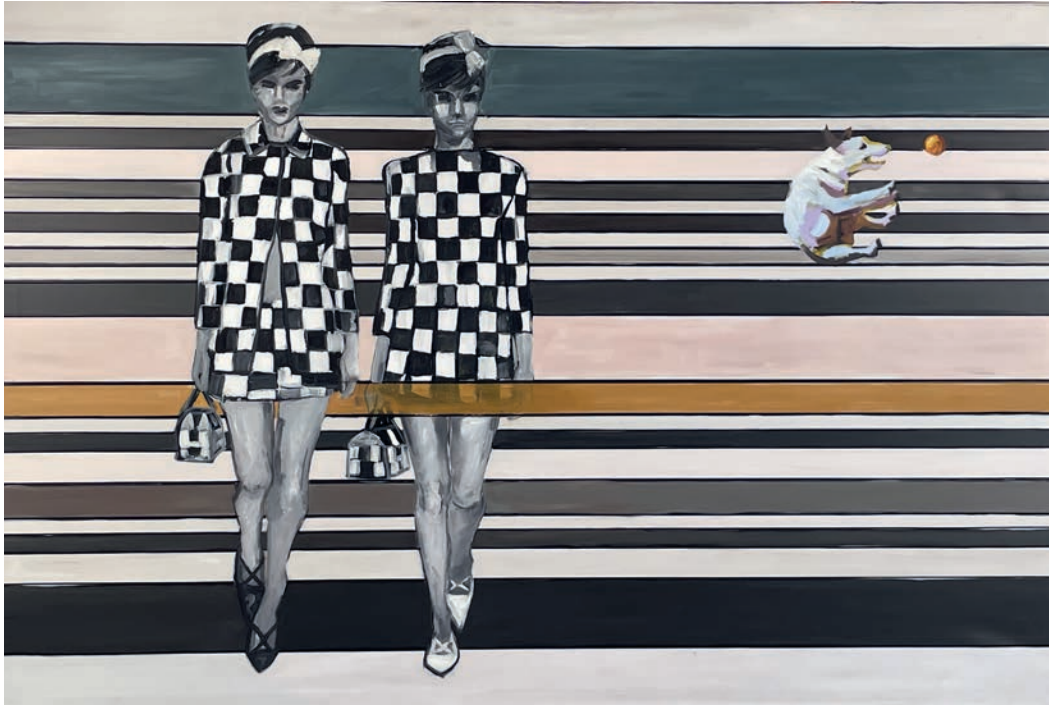
Wohin laufen sie? 2 , 2024, Acryl auf Leinwand, 100 × 150 cm