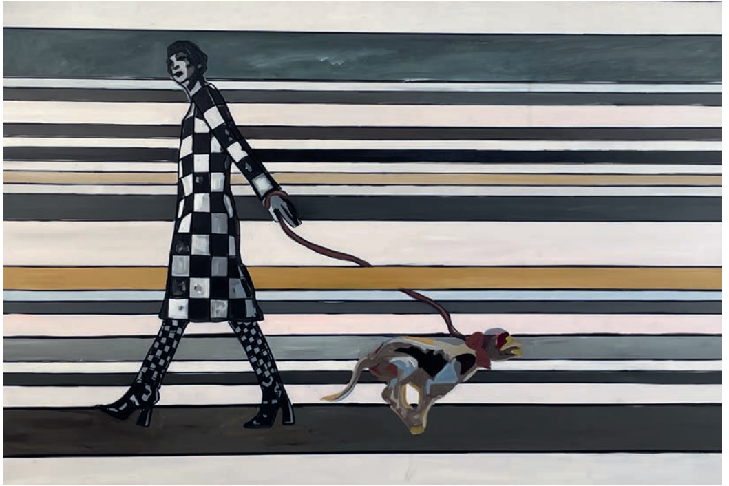
Wohin laufen sie? 1 , 2024, Acryl auf Leinwand, 100 × 150 cm