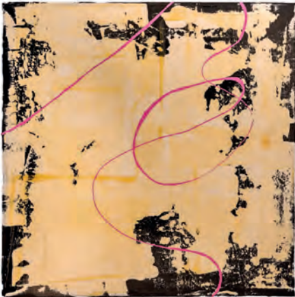
Farb-Schwünge I-III Acryl, Mischtechnik, Latex auf Leinwand je 60 × 60 cm