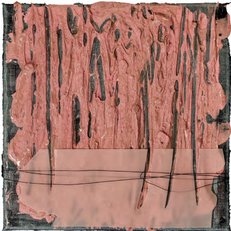
Verbund , Mischtechnik, Collage, Draht auf Leinwand, 20 x 20 cm