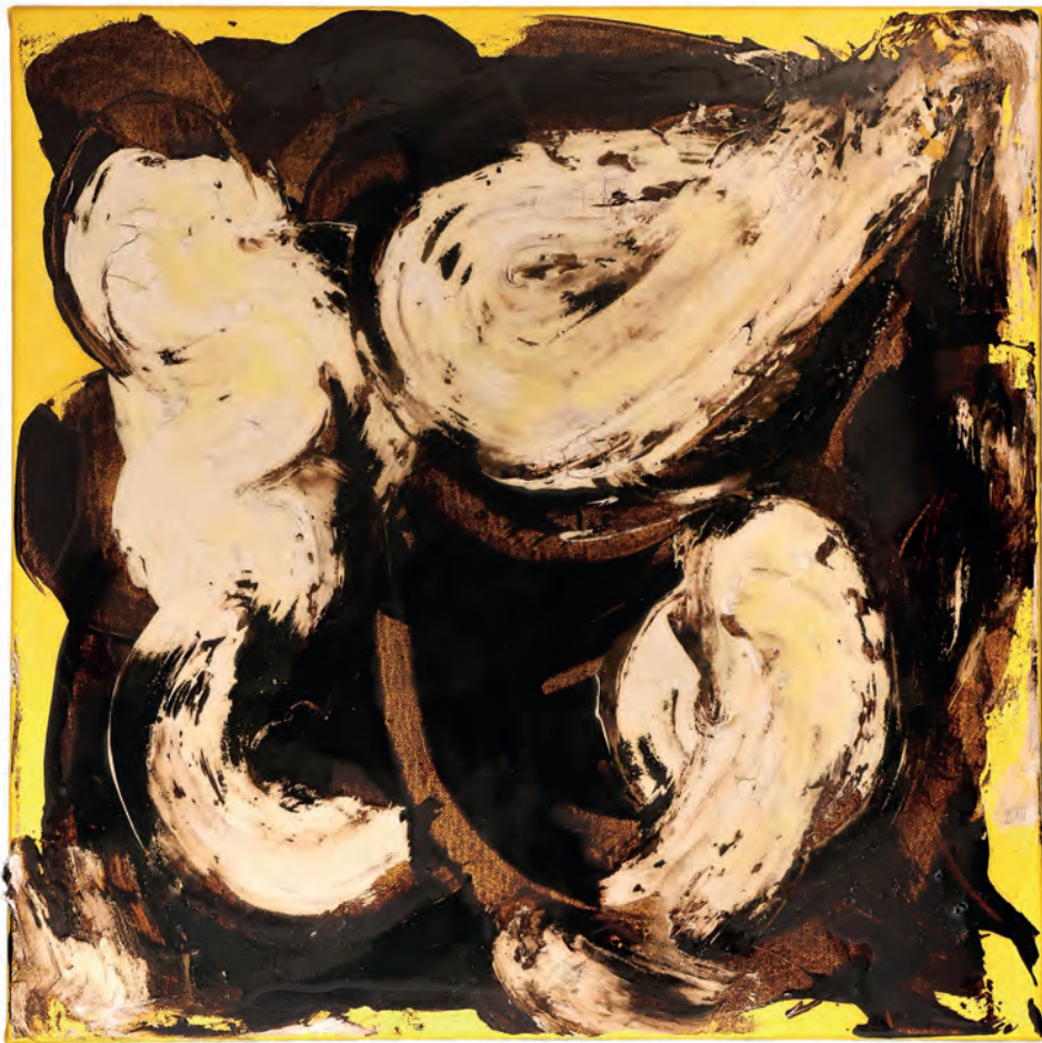
6 Schichten in Bewegung I, Acryl, Mischtechnik, Latex auf Leinwand, 50 × 50 cm