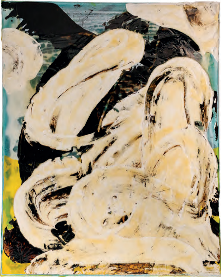
Schichten in Bewegung II, Acryl, Mischtechnik, Latex auf Leinwand, 50 x 40 cm