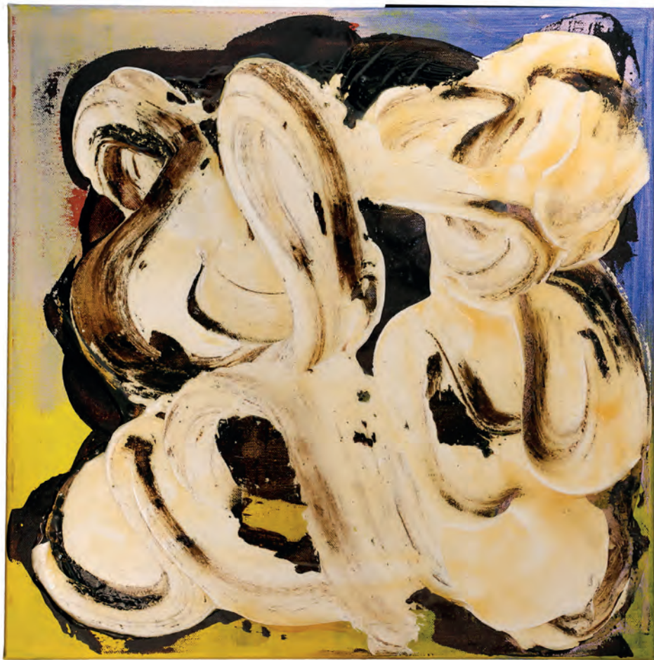
Schichten in Bewegung III, Acryl, Mischtechnik, Latex auf Leinwand, 50 × 50 cm